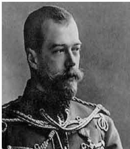
Николай II (1894-1917 гг.)