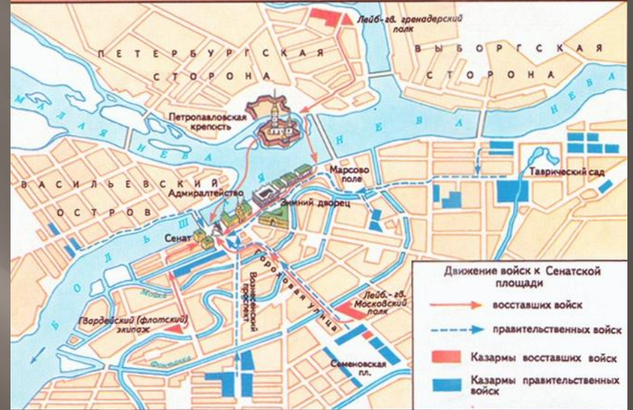
ВОССТАНИЕ ДЕКАБРИСТОВ в С.-ПЕТЕРБУРГЕ 14. XII 1825 г.