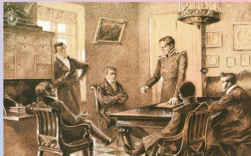
Собрание тайного общества. Худ. К. Гольштейн.