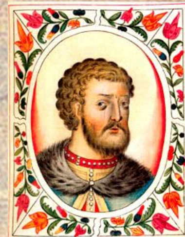
Иван II Красный (1353-1359)

прекратились опустошительные набеги ордынцев и литовцев