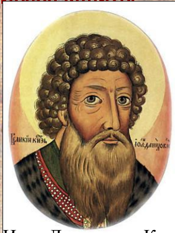
Иван Данилович Калита (1325-1340)