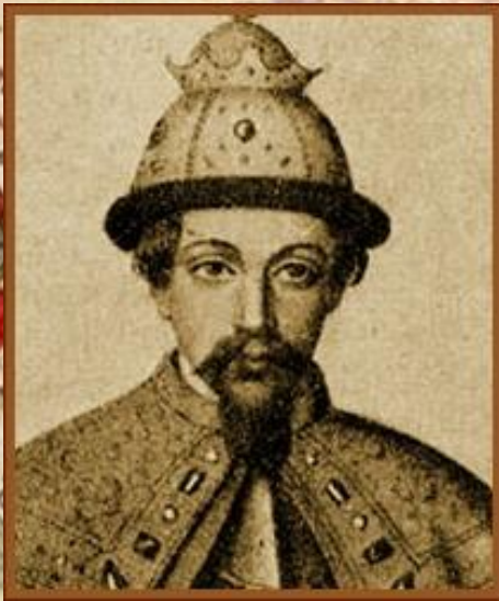
Семен Гордый (1340-1353)