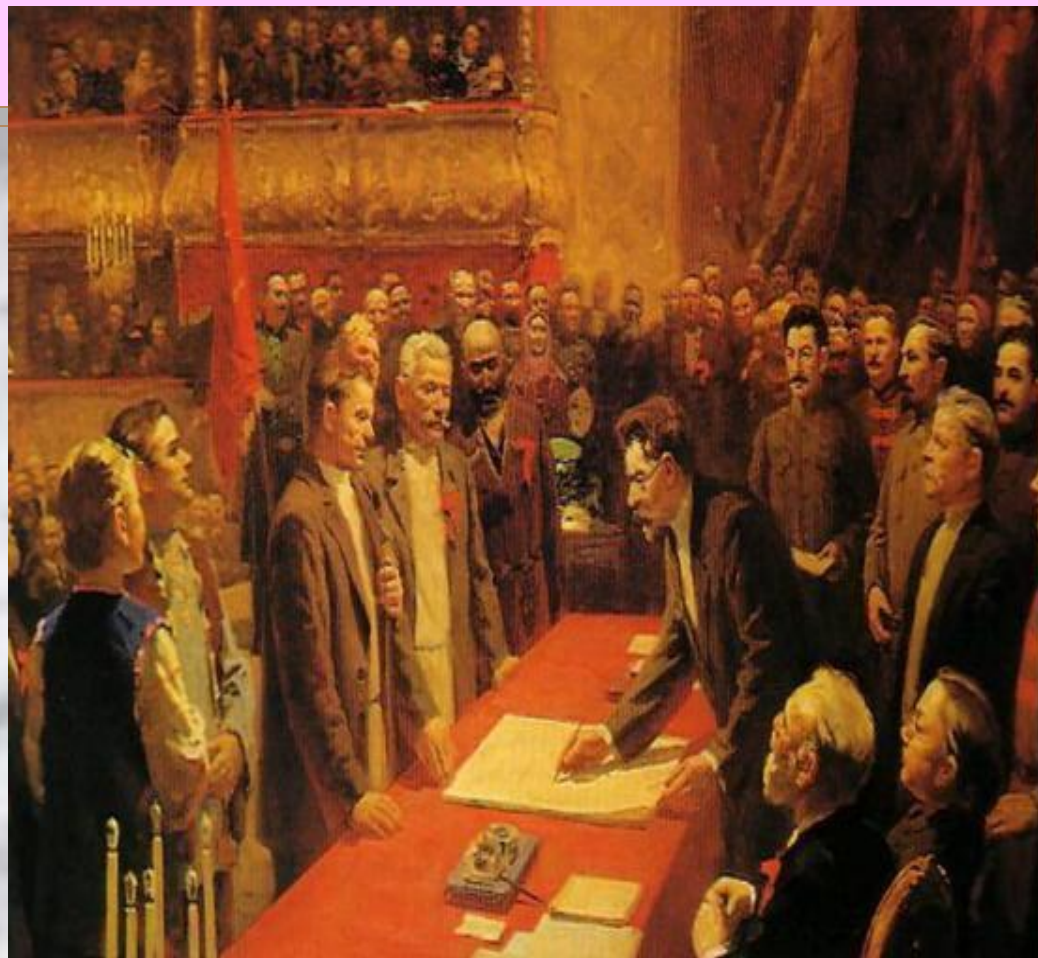
Подписание договора об образовании СССР

Москва, Юридическое Издательство Наркомюста, 1924.