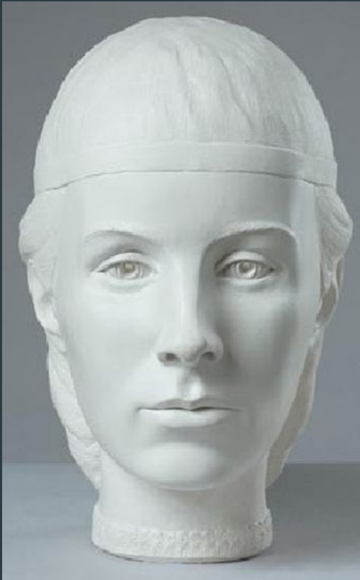
Елена Глинская (1533-1538гг)

После смерти в 1533 году Василия III великим князем стал его трехлетний сын Иван IV, но фактической правительницей стала его мать Елена Глинская.