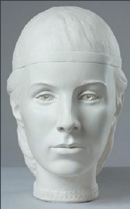
Елена Глинская (1533-1538гг)

После смерти в 1533 году Василия III великим князем стал его трехлетний сын Иван IV, но фактической правительницей стала его мать Елена Глинская.