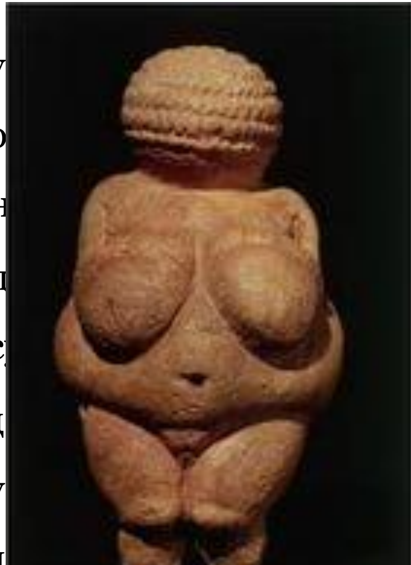
Статуэтка богини-матери. Палеолит