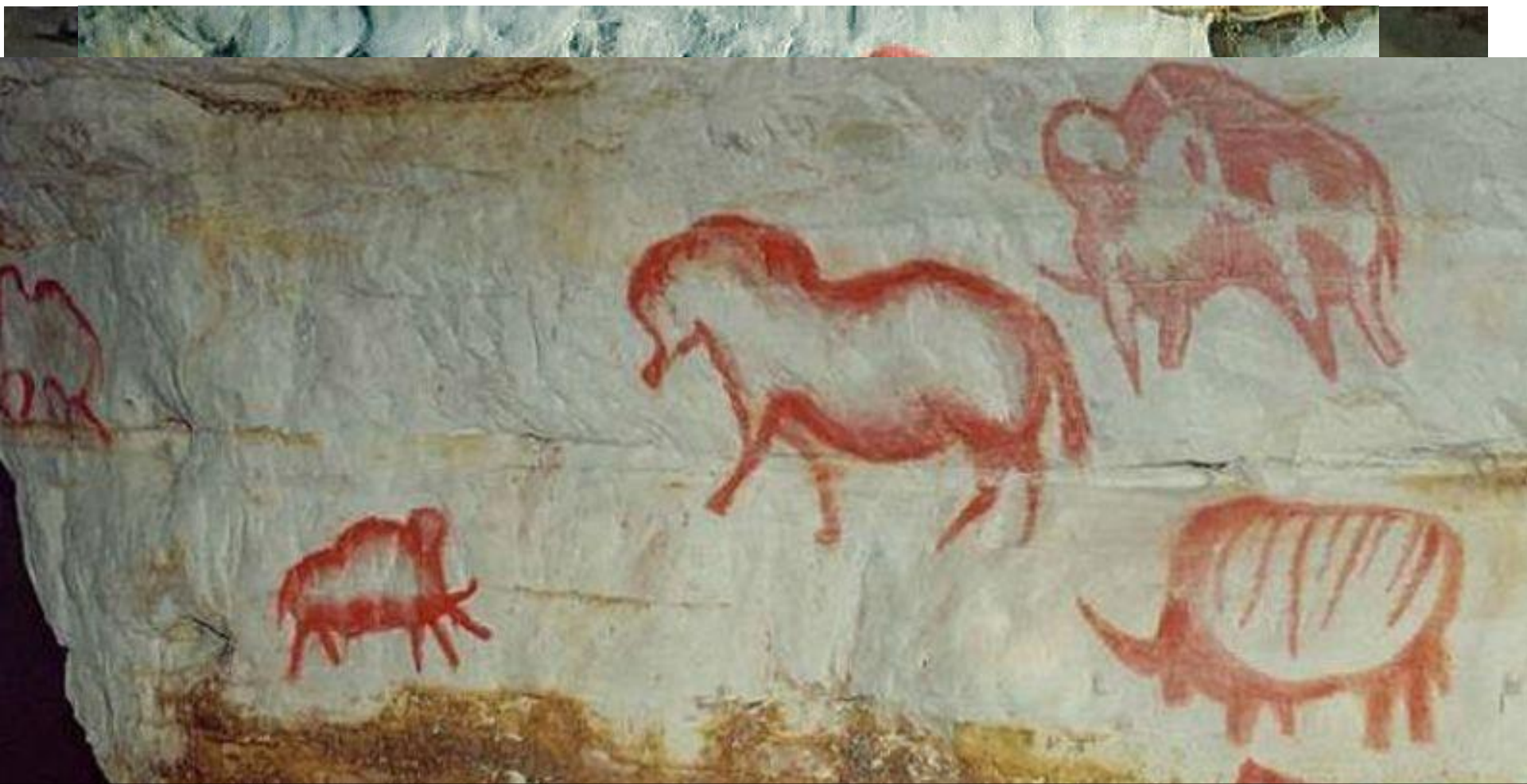
Капова пещера Россия, Урал