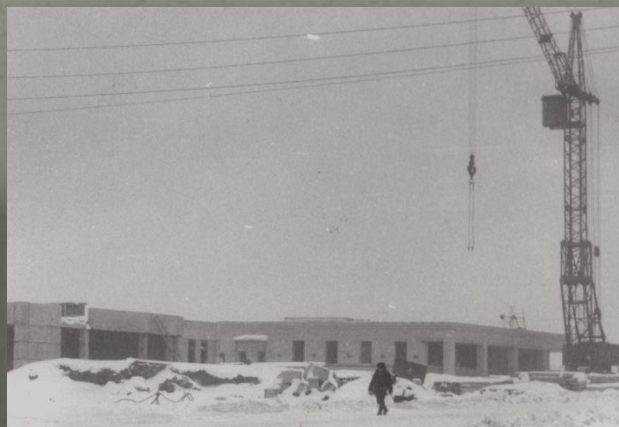
Строительство пекарни и столовой