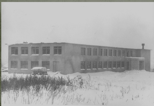
Строительство новой школы