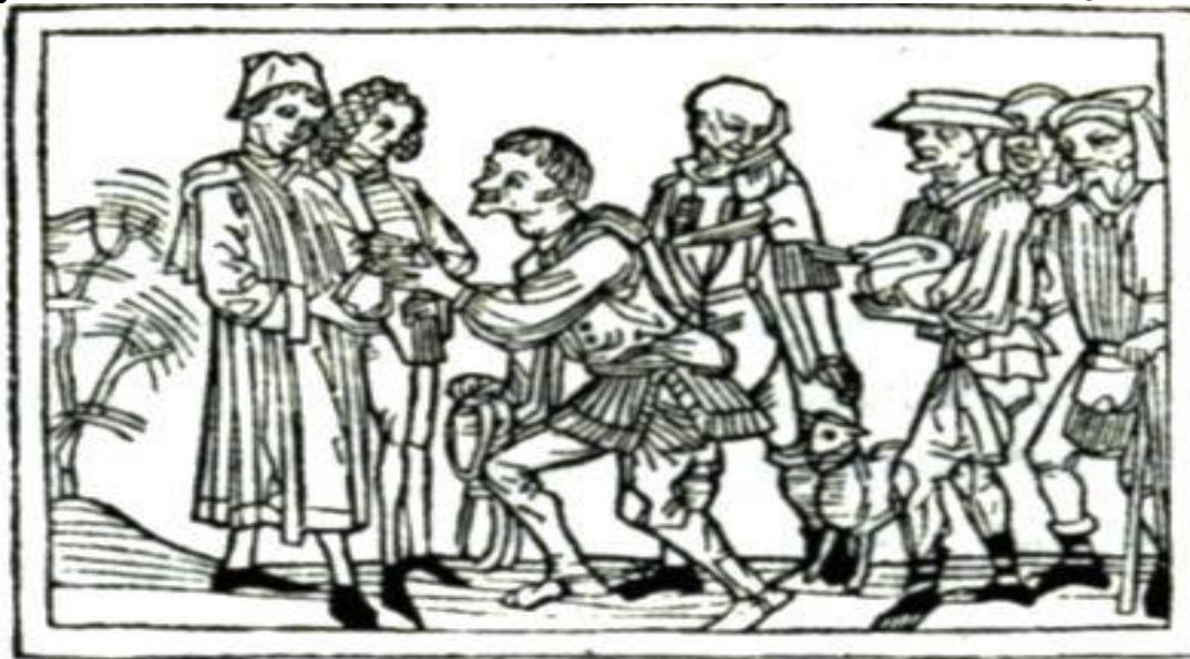
Крестьянин сдает оброк. Гравюра (XV в.)