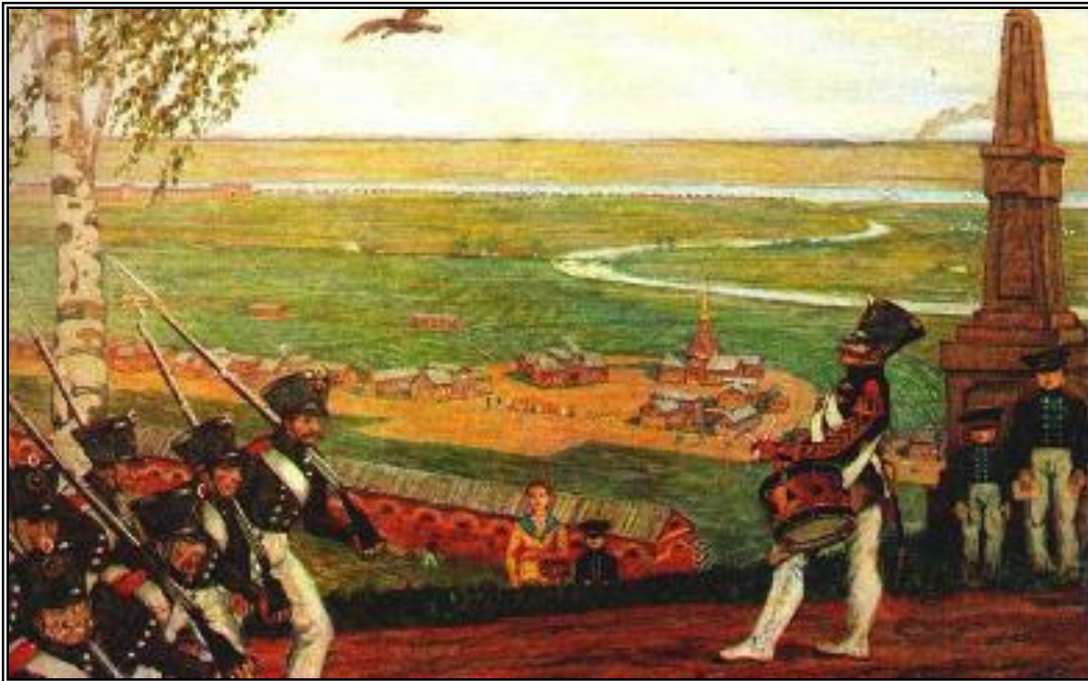
М.Добужинский. В военном поселении.

В разряд военных поселян переводились как отдельные воинские части так и целые деревни. Они должны были заниматься и хозяйством и военной подготовкой.