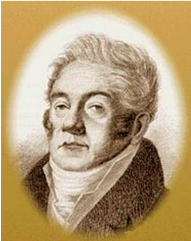
Министр финансов Д.А.Гурьев

В 1818-19 гг. под руководством Д.А. Гурьева был разработан еще один секретный проект: разрушение крестьянской общины и создание фермерских хозяйств капиталистического типа.