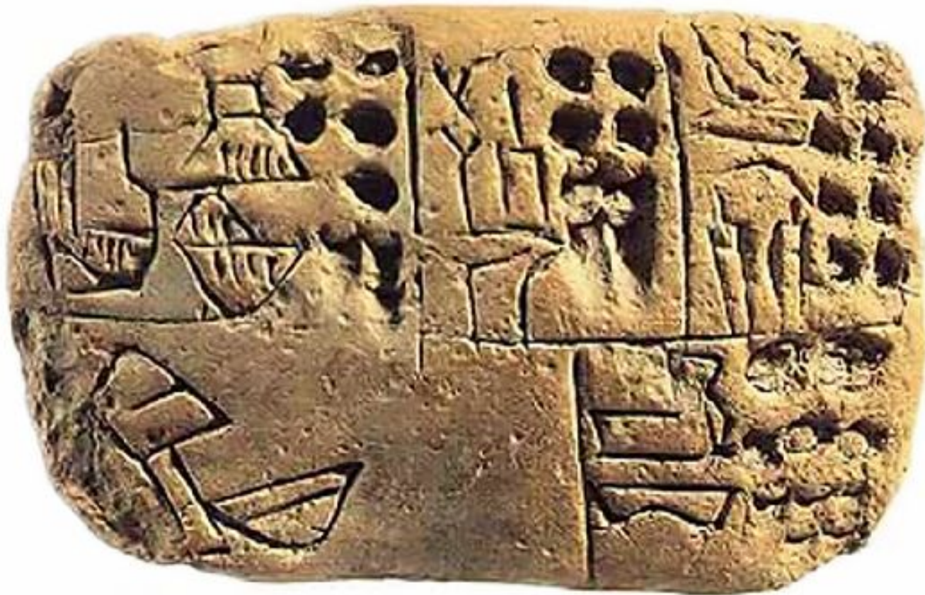
Месопотамия. Урук, III – конец IV тыс. до н. э.