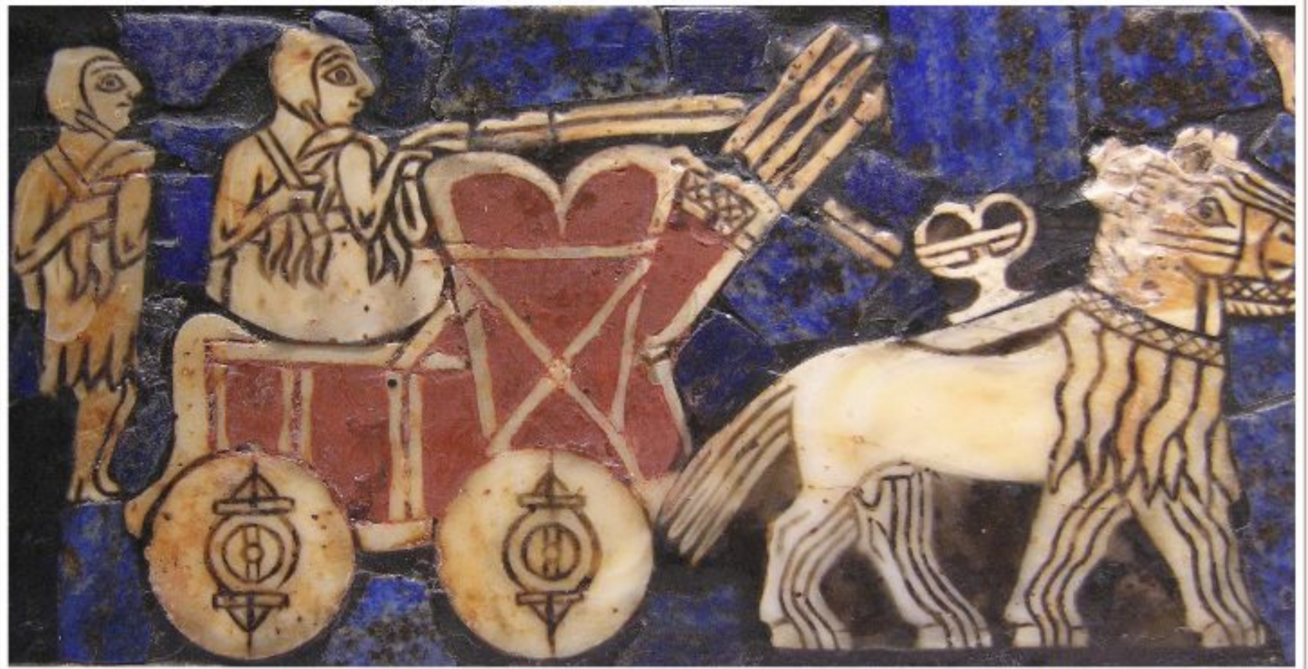
Колесница. Штандарт из Ура, фрагмент.