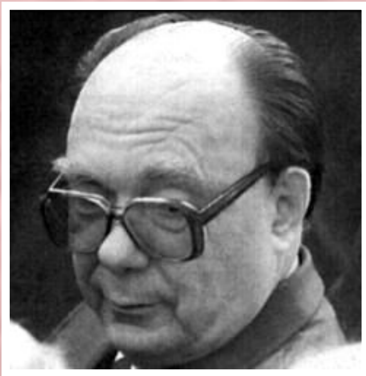
Секретарь ЦК КПСС по идеологии А.Н.Яковлев.

Гласность привела к переосмыслению прошлого. В печати были подняты «закрытые» прежде темы, критике подверглись ближайшие соратники Ленина.