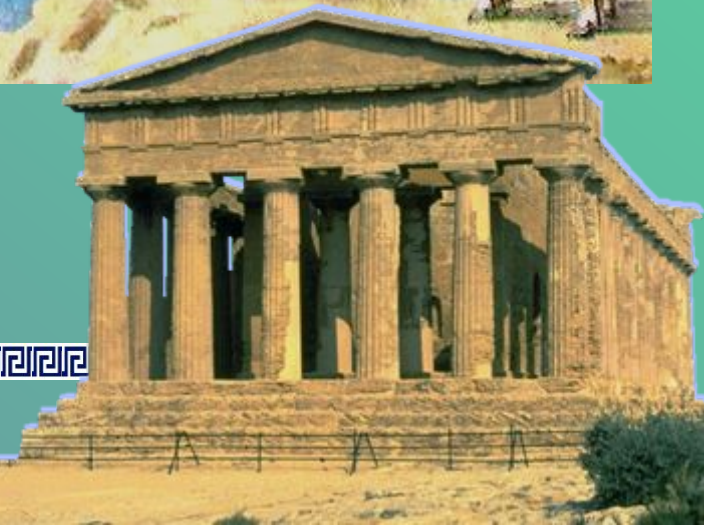
Храм Геры на о.Сицилия