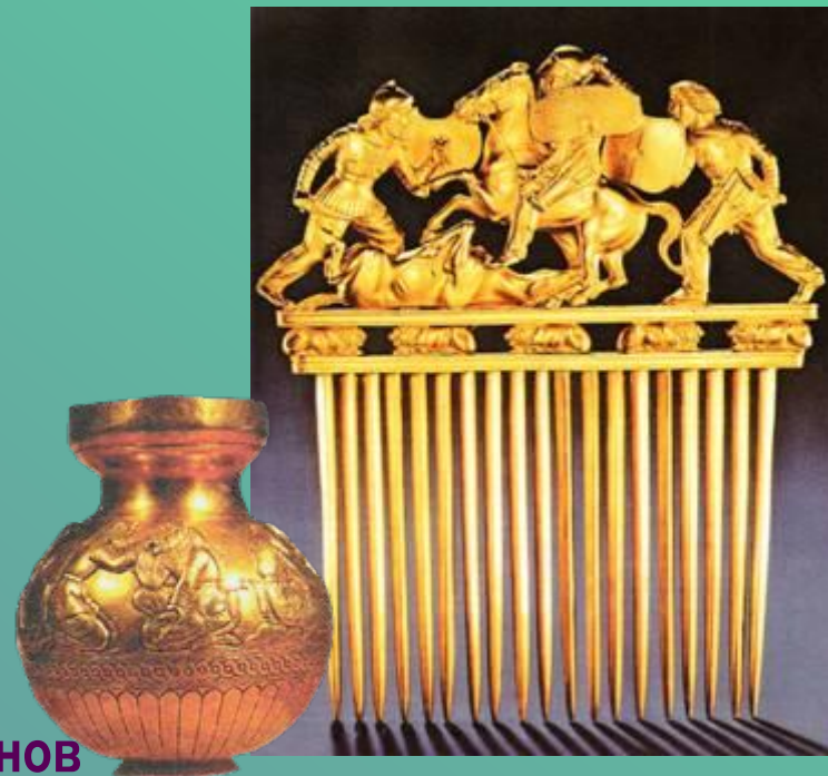
Золотые вещи из скифских курганов