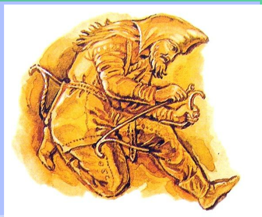
скифский лучник. Изображение на евнегреческой вазе