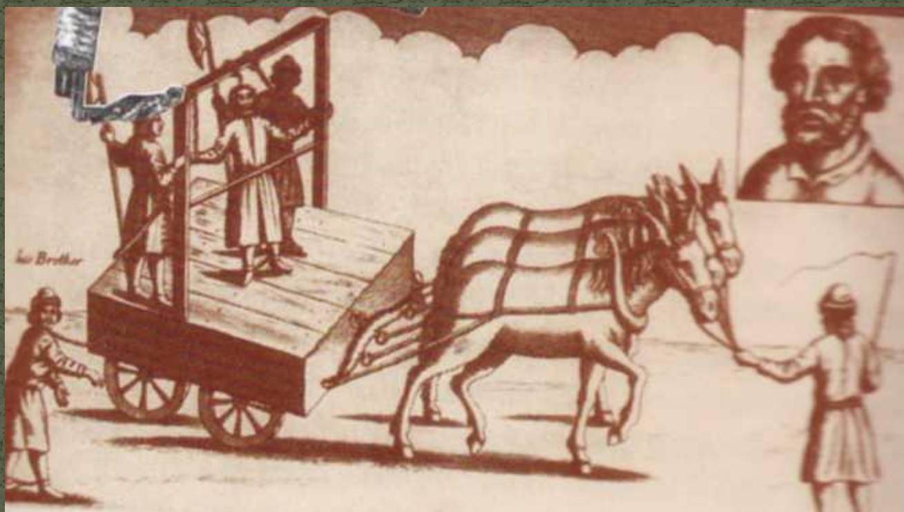
Ввоз Степана и Фрола Разина в Москву на казнь. Гравюра из английского издания 1672 г.