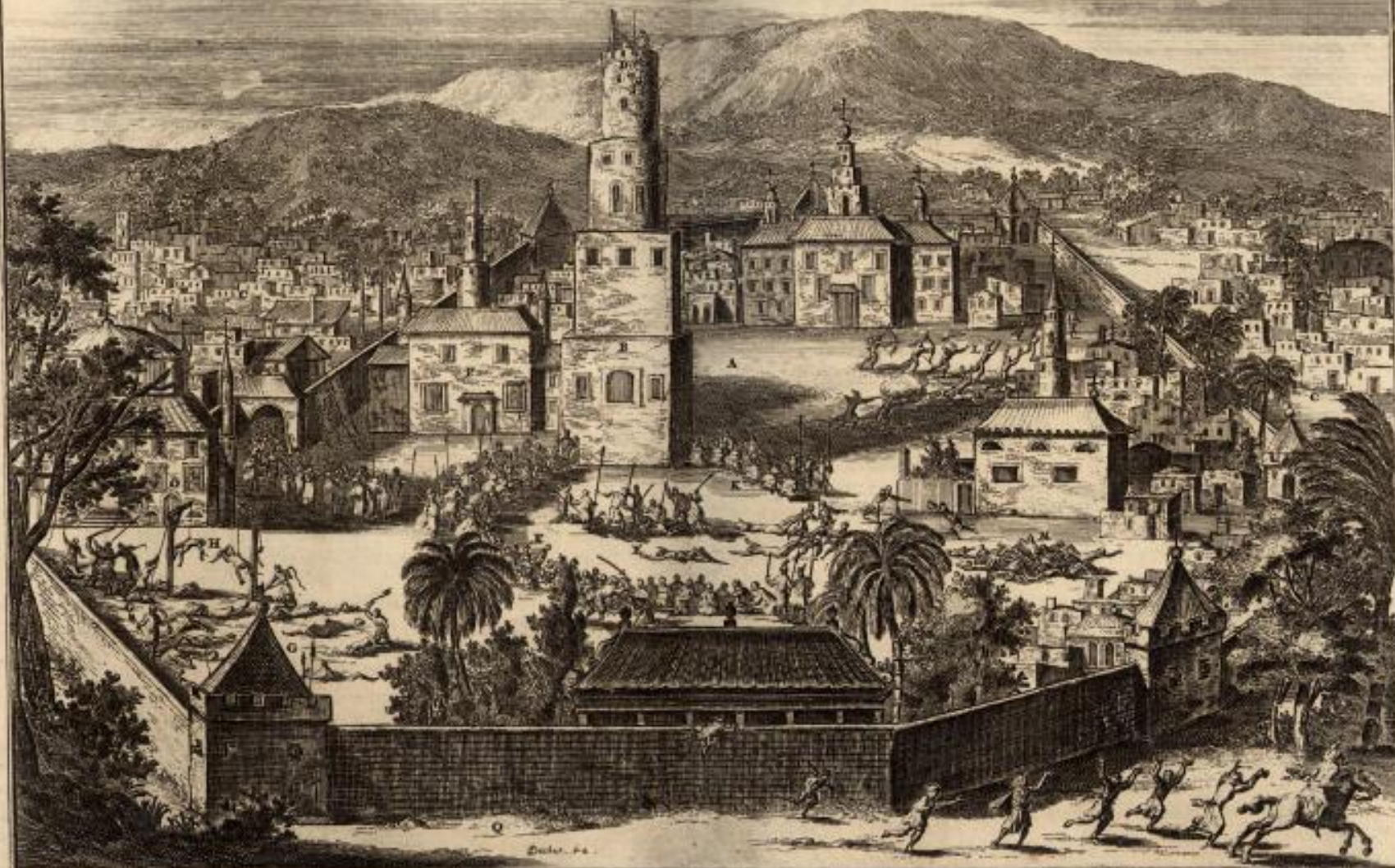
A. La Forteresse d'Astrakan. B. Vue des états de la Forteresse. C. La Ville d'Astrakan. D. Les Prisons des Musulmans prisiers. E. Le haut de la Tour. F. Le Gouverneur avec ses officiers et le Sultan. G. Le Secrétaire d'Etat. H. Le Cheval de l'Empereur. I. Les deux fils du Gouverneur avec deux autres de ses enfants par les pieds. J. Les Turcs pris et tués. K. Un Prisonnier. L. Les Turcs pris et tués. M. Le Sultan. N. Un Prisonnier. O. Le Sultan. P. Le Sultan de l'Empire. Q. Le Sultan de l'Empire.