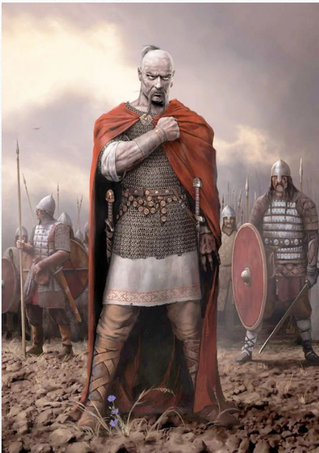
СВЯТОСЛАВ (964 - 972 г.г.)

Сын князя Игоря и княгини Ольги. Инициатор и руководитель многих военных походов: