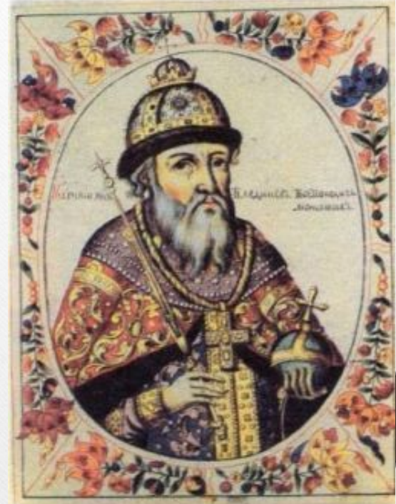
Великий князь Владимир II Всеволодович Мономах.

Продолжил политику укрепления династических связей с Европой.