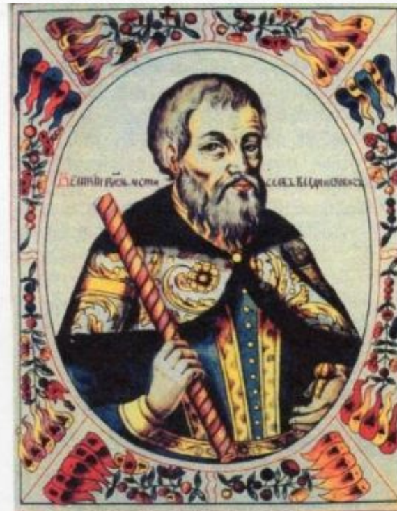
Великий князь Мстислав I Владимирович Великий.

Организовал успешные походы против половцев, Литвы, черниговского князя Олега Святославовича. После его смерти почти все княжества выходят из повиновения Киеву. Наступает период феодальной раздробленности.