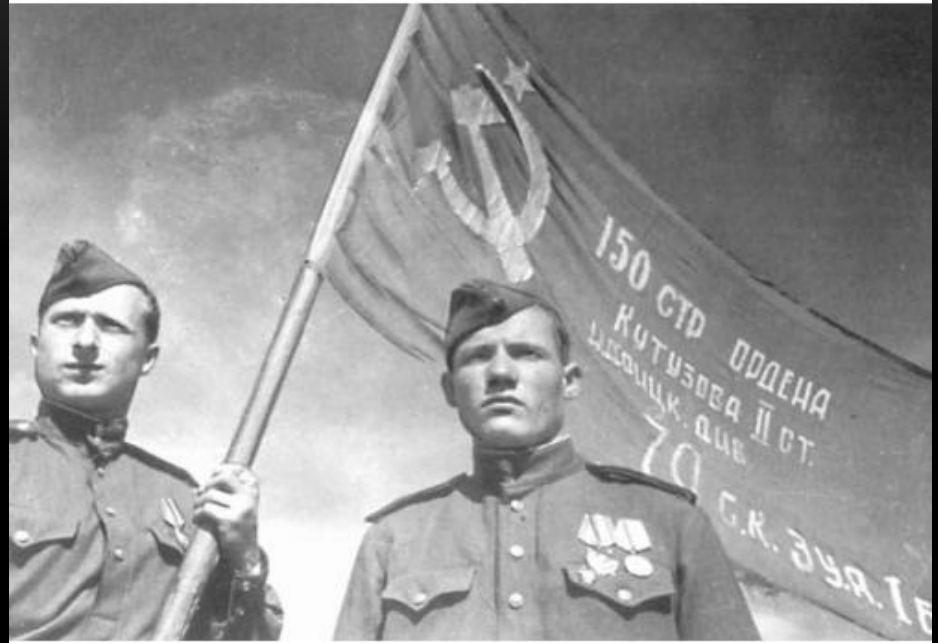
Егоров и Кантария

16 апреля 1945 года началась Берлинская операция : командующие фронтами Г.К. Жуков, И. С. Конев , К.К. Рокоссовский 21 апреля советские части вошли в город . 30 апреля в своем бункере покончил жизнь самоубийством А. Гитлер. На следующий день над зданием рейхстага развевалось Красное знамя.