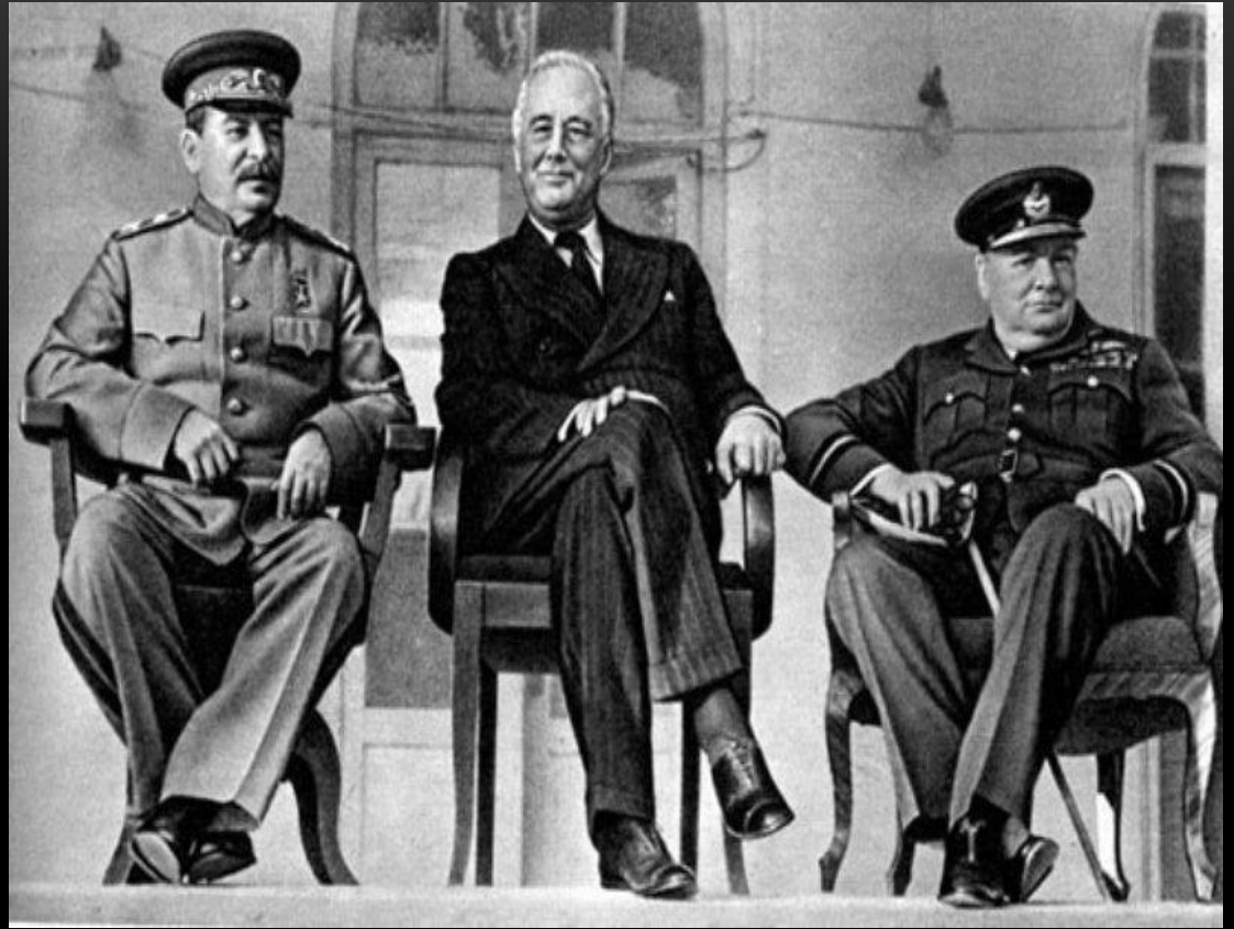
Встреча в Тегеране

И . Сталин , Ф . Рузвельт и У . Черчилль обсуждали главным образом вопрос о втором фронте , а также некоторые вопросы устройства послевоенного мира .