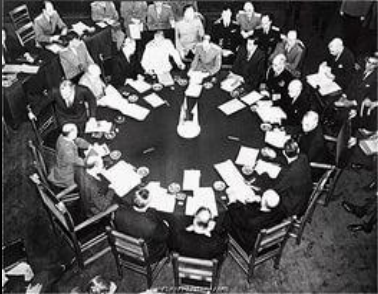
Конференция в Потсдаме

17 июля- 2 августа 1945 г. В Потсдаме (под Берлином) состоялась конференция глав правительств СССР, США, Великобритании. Участвовавшие в ней И. Сталин , Г. Трумэн К. Эттли . Была принята программа демократизации, денацификации, демилитаризации Германии