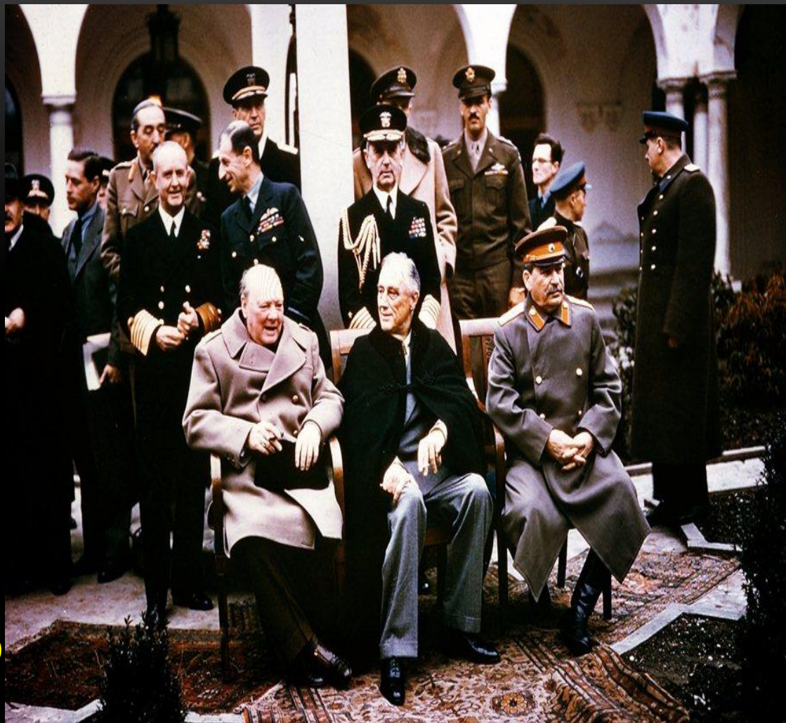
Встреча в Ялте

4-11 февраля 1945 года в Ялте состоялось конференция глав правительств СССР, США и Великобритании. И. Сталин, Ф. Рузвельт и У. Черчилль согласовали планы военных операций против Германии и послевоенную политику по отношению к ней: зоны и условия оккупации, действия по уничтожению фашистского режима, порядок взимания репараций