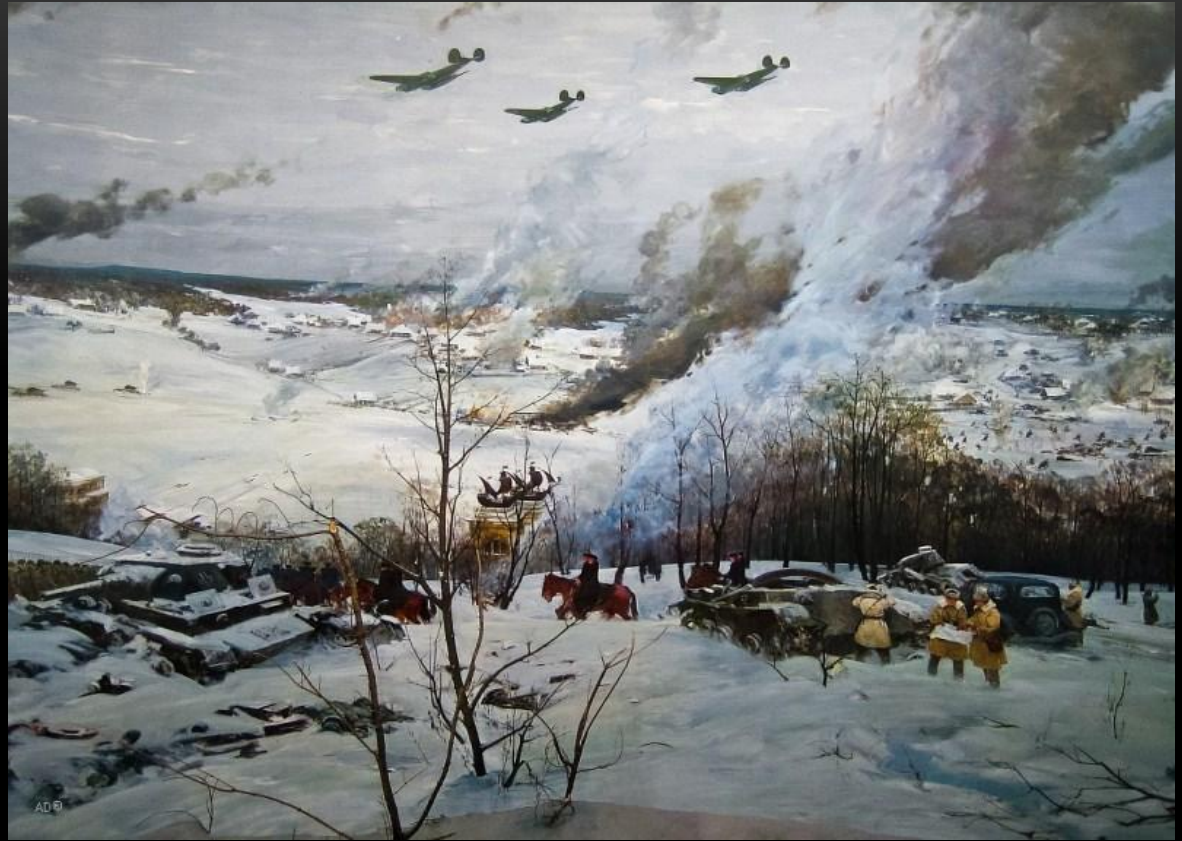
Битва под Москвой

30 сентября 1941 года началась битва под Москвой. Победа Красной Армии под Москвой стала возможной благодаря стойкости и героизму ее защитников и искусству полководцев И.С. Конева, Г.К. Жукова, С.К. Тимошенко. Это было первое крупное поражение Германии во Второй мировой войне.