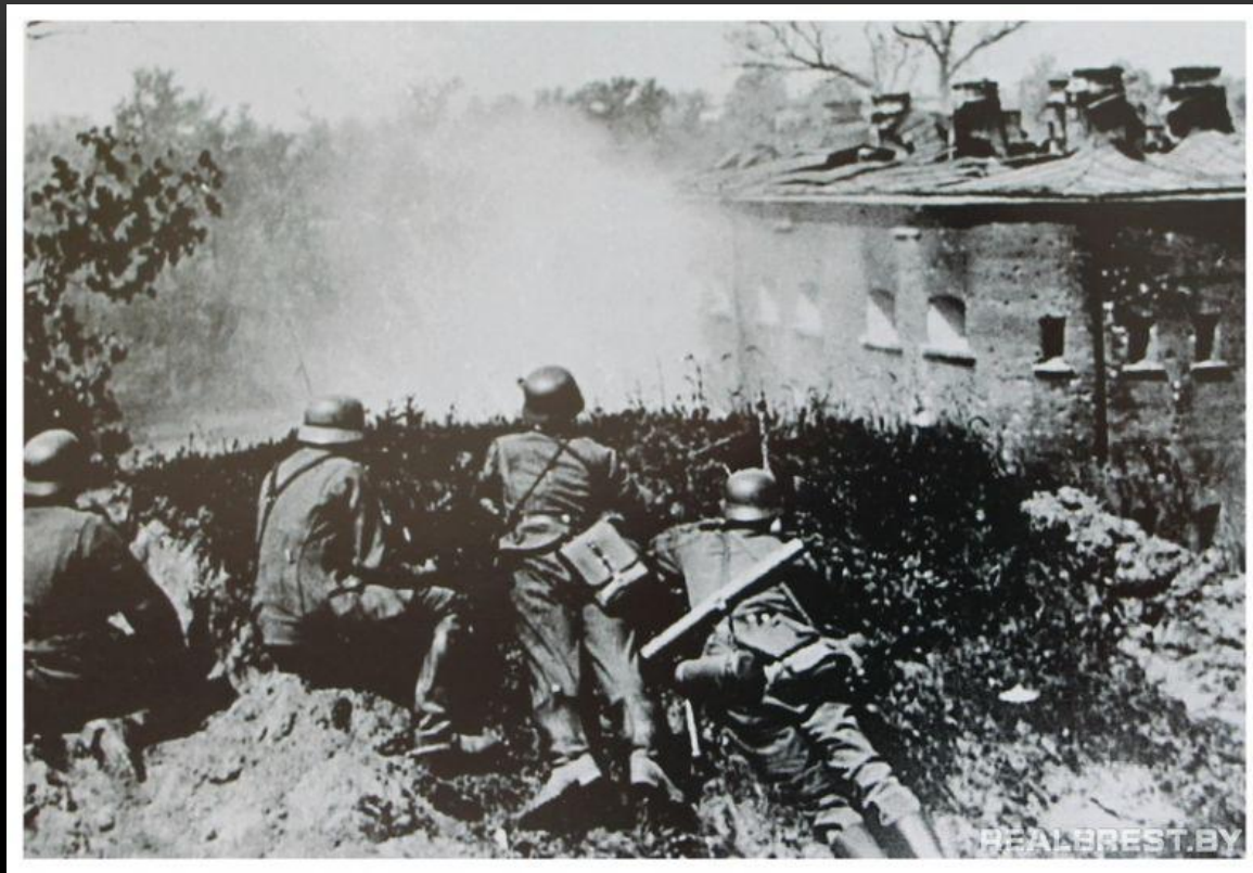
Штурм Брестской крепости

22 июня 1941 года армия Германии и ее союзников напали на СССР . Начался новый этап второй мировой войны . Ее главным фронтом стал советско-германский фронт, важнейшей составной частью-Великая Отечественная война советского народа против захватчиков.