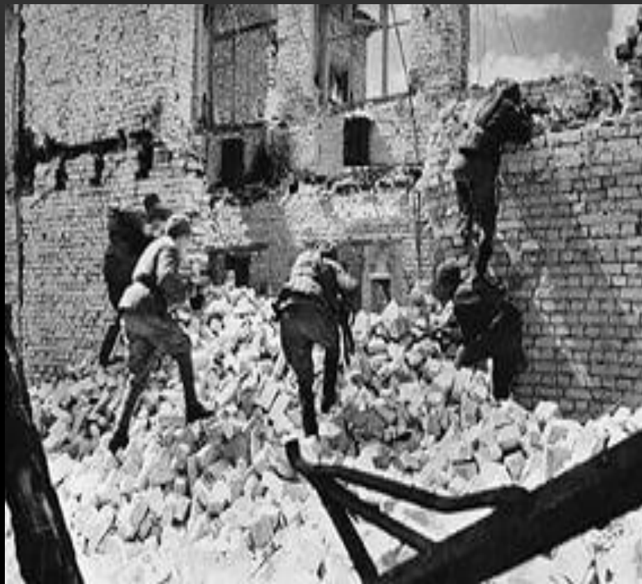
Штурм дома Павлова

Бои за Сталинград длились более 3 месяцев, город обороняла 62 и 64 армии под командованием В.И Чуйкова и М.С Шумилова 19 ноября 1942 года контрнаступление (командующие фронтами - Н.Ф Ватутин , К.К Рокоссовский , А.И Еременко) завершилось окружением немецких армий, их последующим разгромом и пленением, включая командующего фельдмаршала Ф . Паулюса.