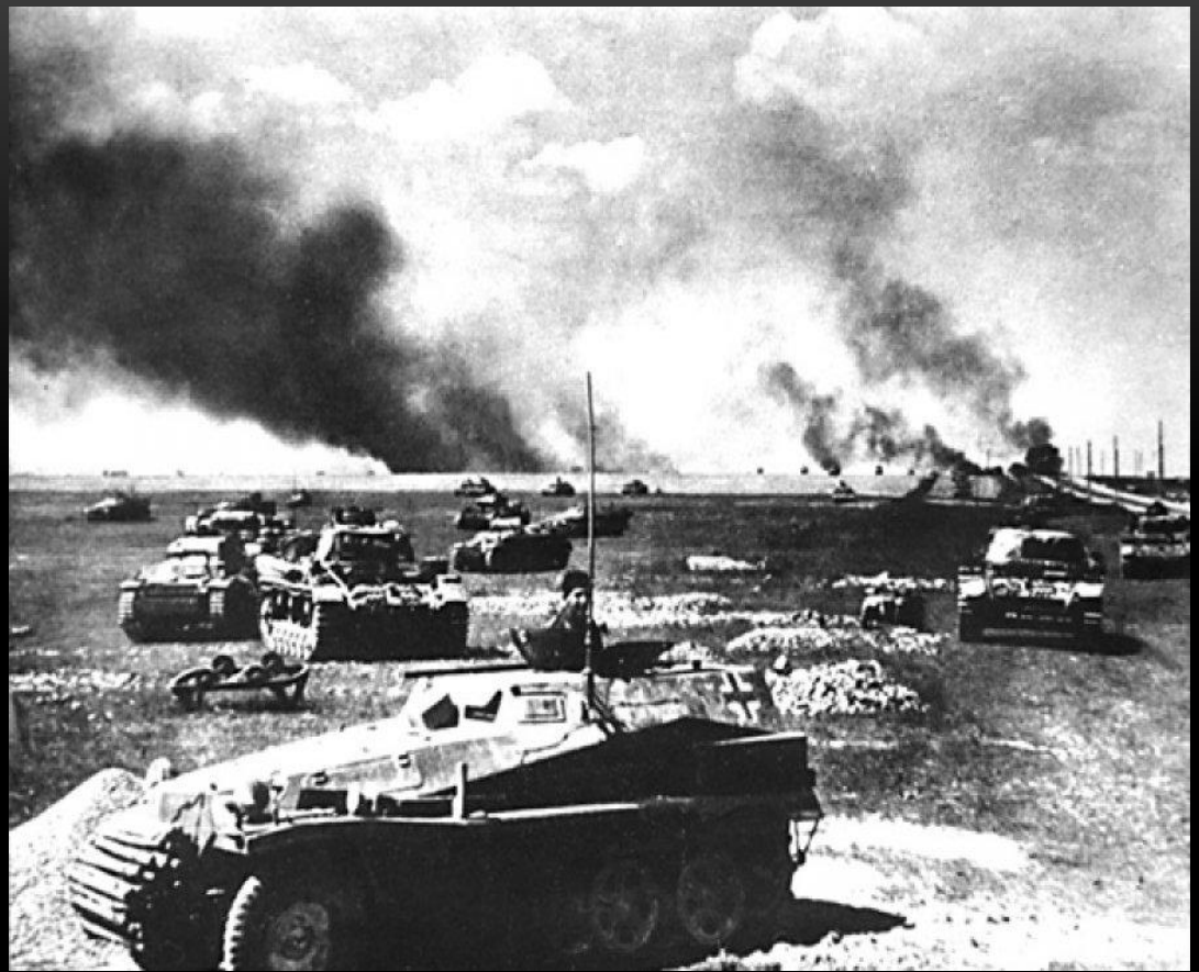
Великое танковое сражение

Стратегическая инициатива перешла к Красной Армии