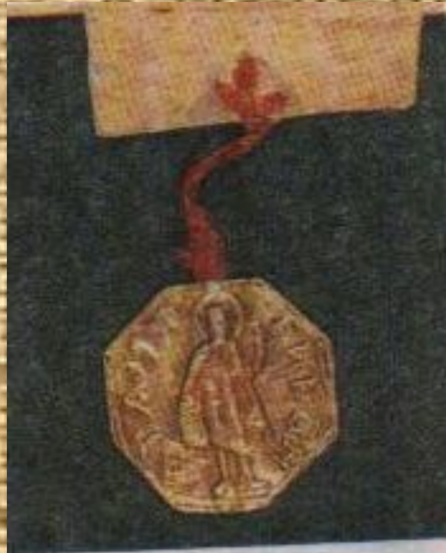
Печать Ивана Калиты