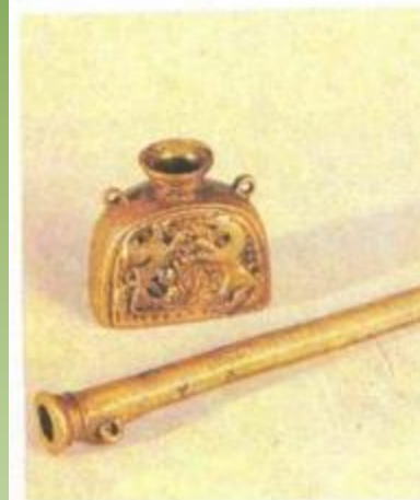
Подсвечник, свечные щипцы. Чернильница, футляр для перьев (перница) (первая половина XVIII в.)