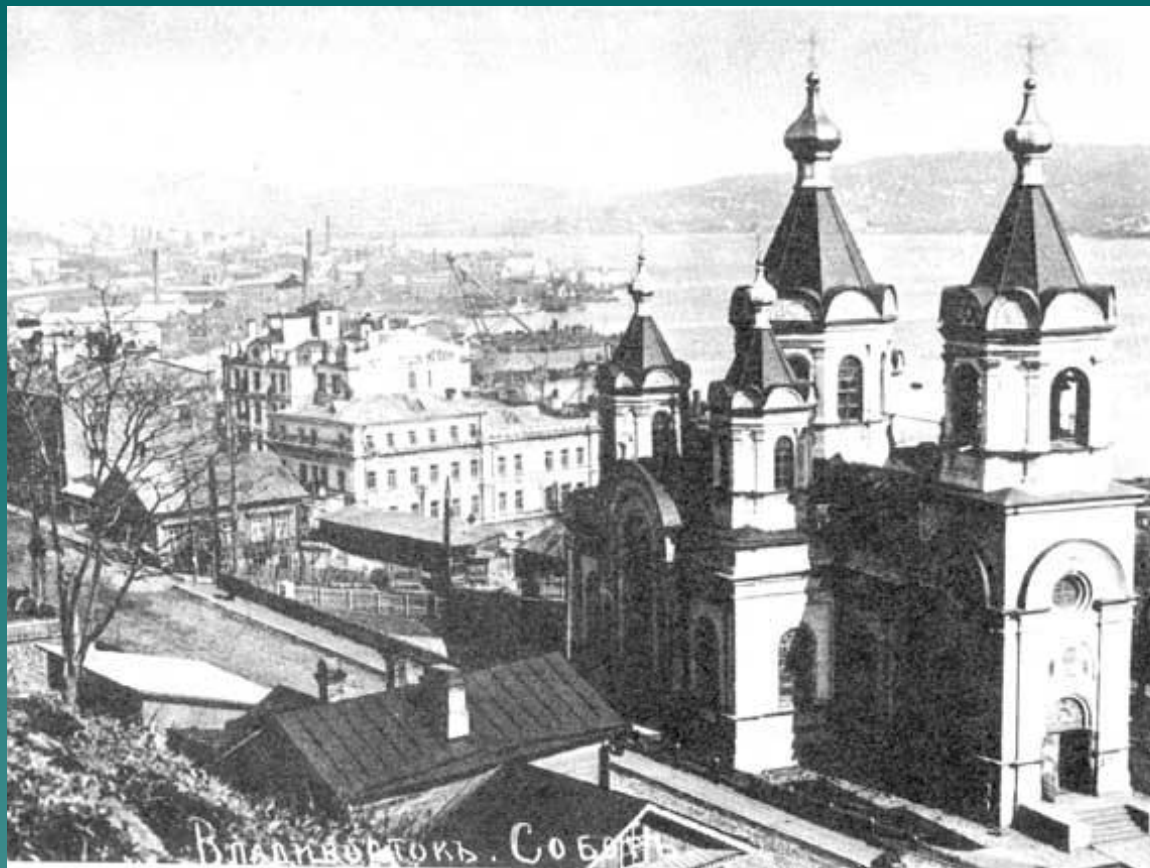
Успенский храм г. Владивостока. Фото до 1917 г.