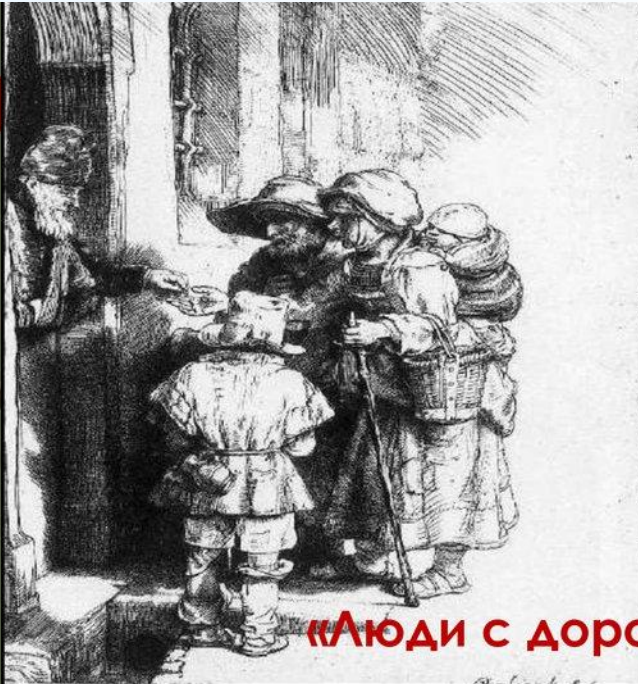
Нищие, получающие милостыню у двери дома. (Рембрандт)

* По каким причинам наемные работники могли впасть в нищету?