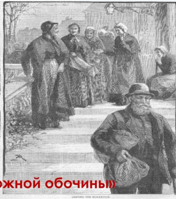
Покидая рабочий дом