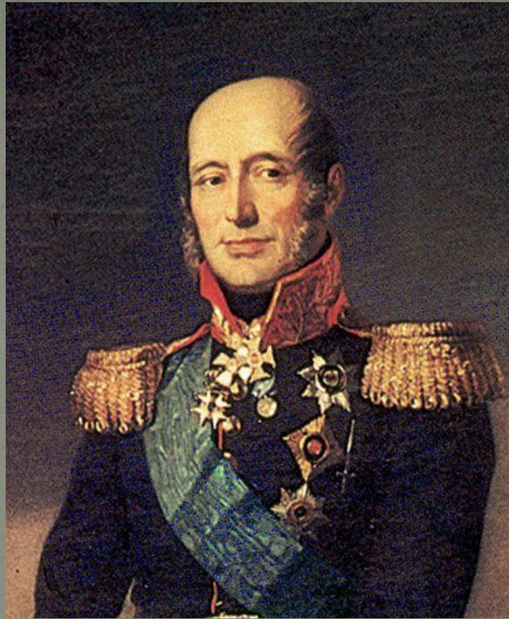
Барклай де Толли – военный министр , командующий 1 –й русской армией