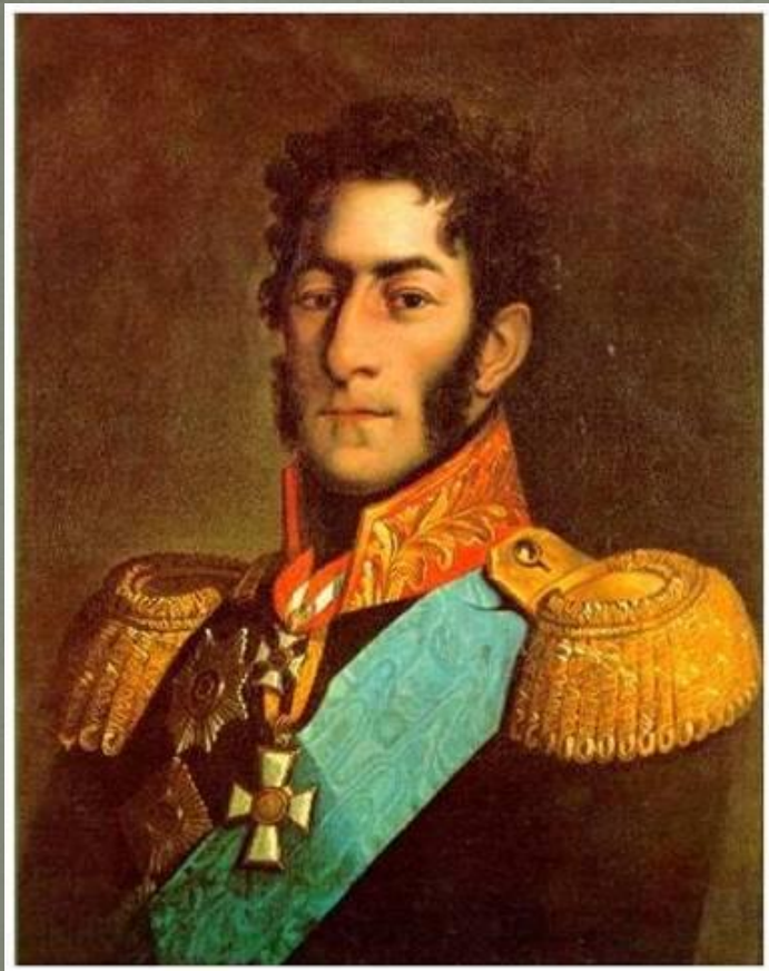
Багратион П.И. Самые ожесточённые бои развернулись на Багратионовых флешах и батарее генерала Раевского.