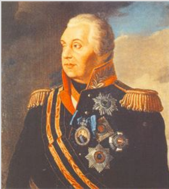
Кутузов Михаил Илларионович