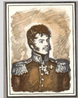
А. И. Кутайсов

Плохая им досталась доля : Не многие вернулись с поля... Не будь на то господня воля , Не отдали б Москвы!