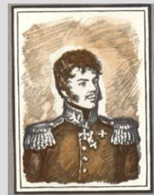
А. И. Кутайсов

Плохая им досталась доля : Не многие вернулись с поля... Не будь на то господня воля , Не отдали б Москвы!