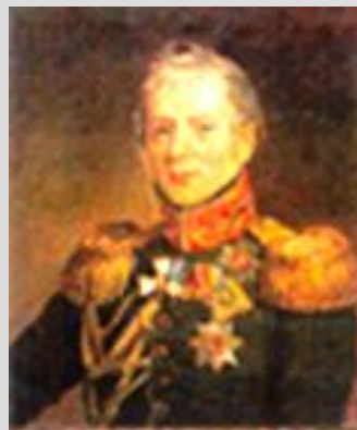
П. П. Коновницин