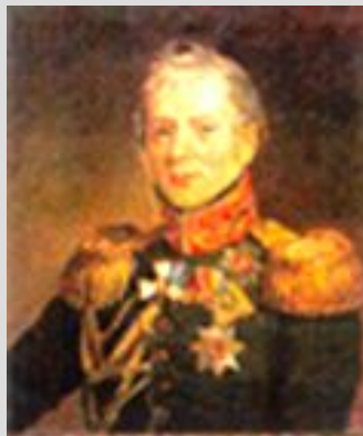
П. П. Коновницин