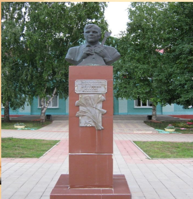
Бюст М.А. Щербину, заслуженному работнику культуры РСФСР