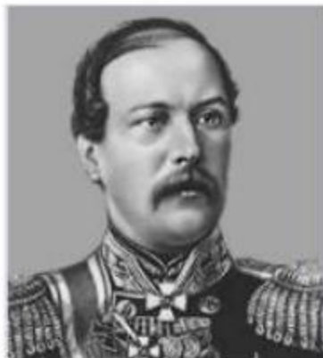
ТОТЛЕБЕН Э. И.