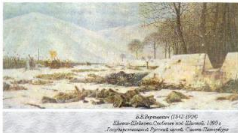
Б. В. Верещагин (1842-1904) Шипка-Шейново. Селения под Шипкой. 1877 г. Государственный Русский музей, Санкт-Петербург