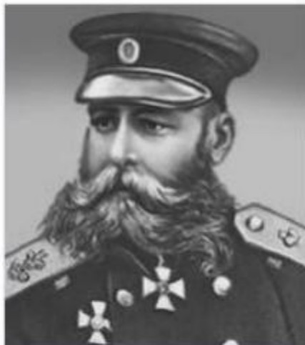
СКОБЕЛЕВ М. Д.