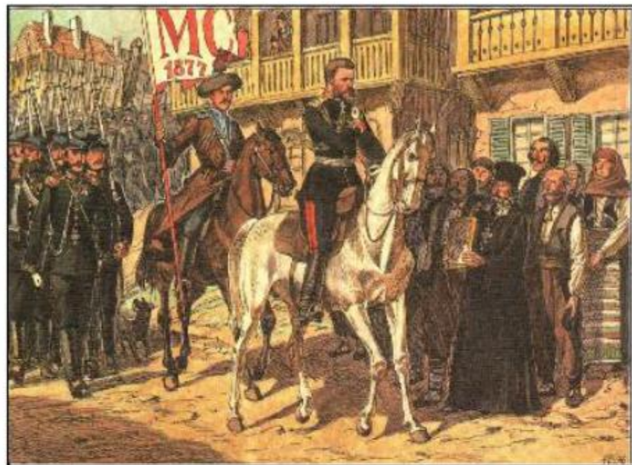
Скобелев М. Д. во главе русских войск вступает в болгарский город.