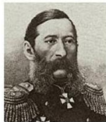
ЛОРИС-МЕЛИКОВ М. Т.