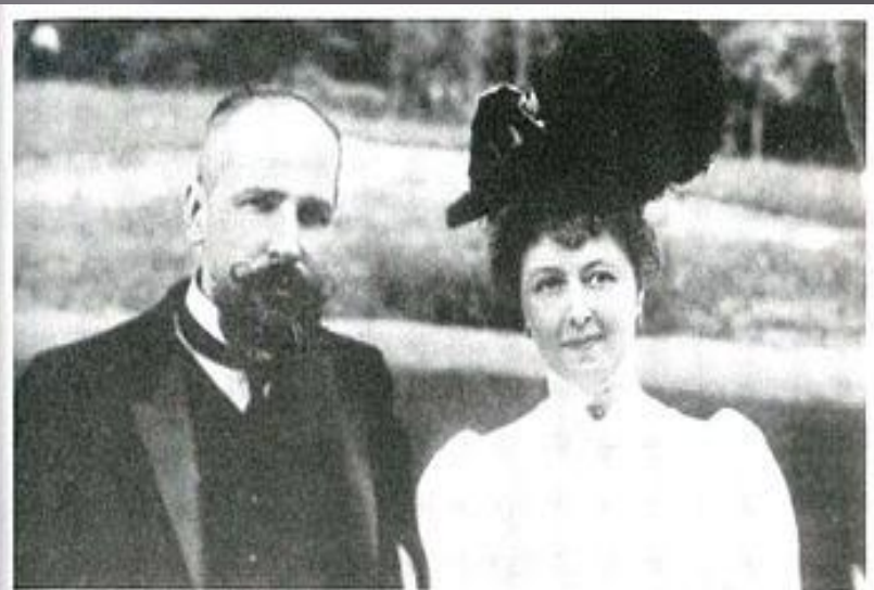
П.А.Столыпин — министр внутренних дел с супругой. 1906 год