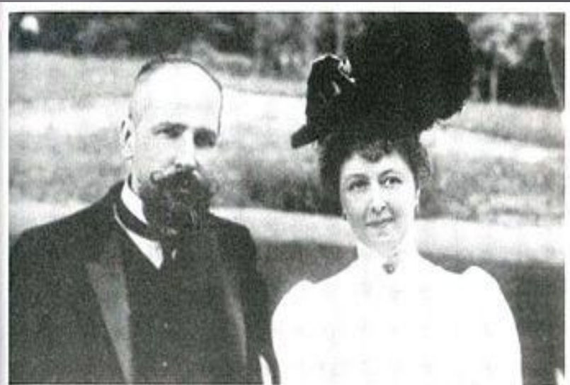
П.А.Столыпин — министр внутренних дел с супругой. 1906 год