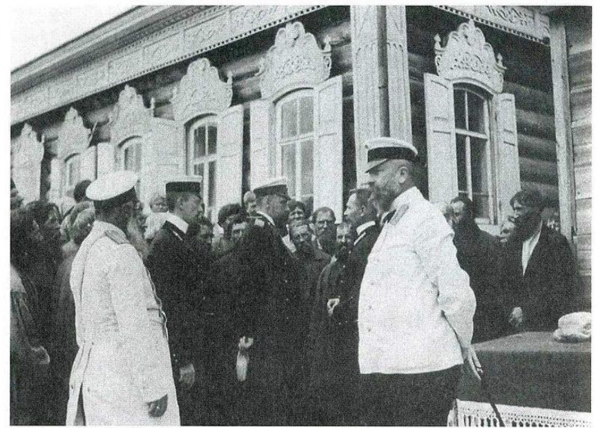
Станция Булгаковка Вольского уезда Саратовской губернии. Июль 1904 года