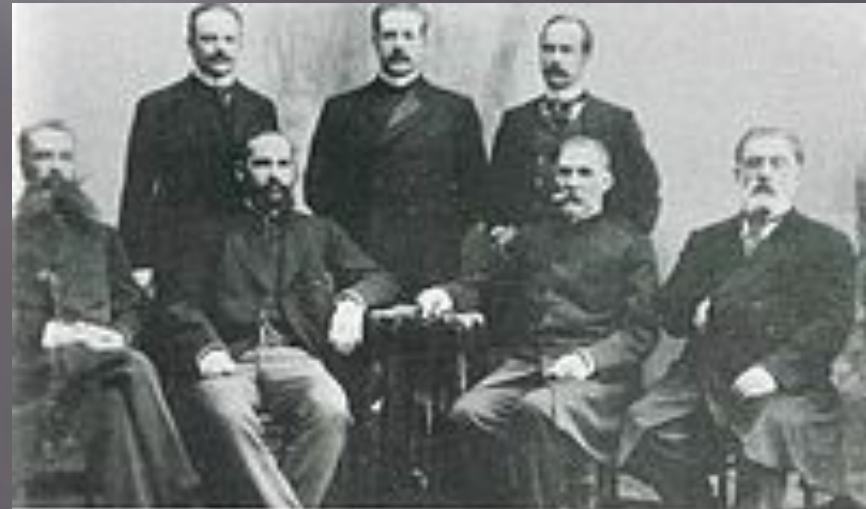
П.А. Столыпин — в Ковно, с уездными предводителями дворянства Ковенской губернии. 1901 год