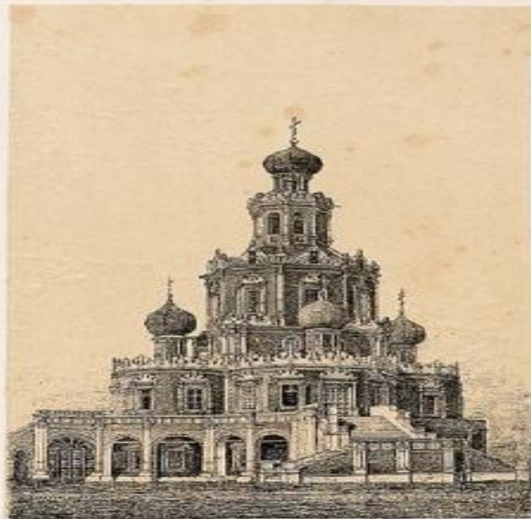
Церковь Святого Духа, на Фили.