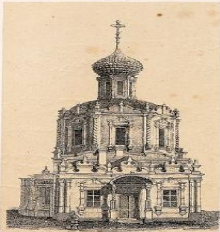
Благовестная церковь в Москве.

В конце XVII в. в храмовой архитектуре возникает новый стиль - нарышкинское (московское) барокко.