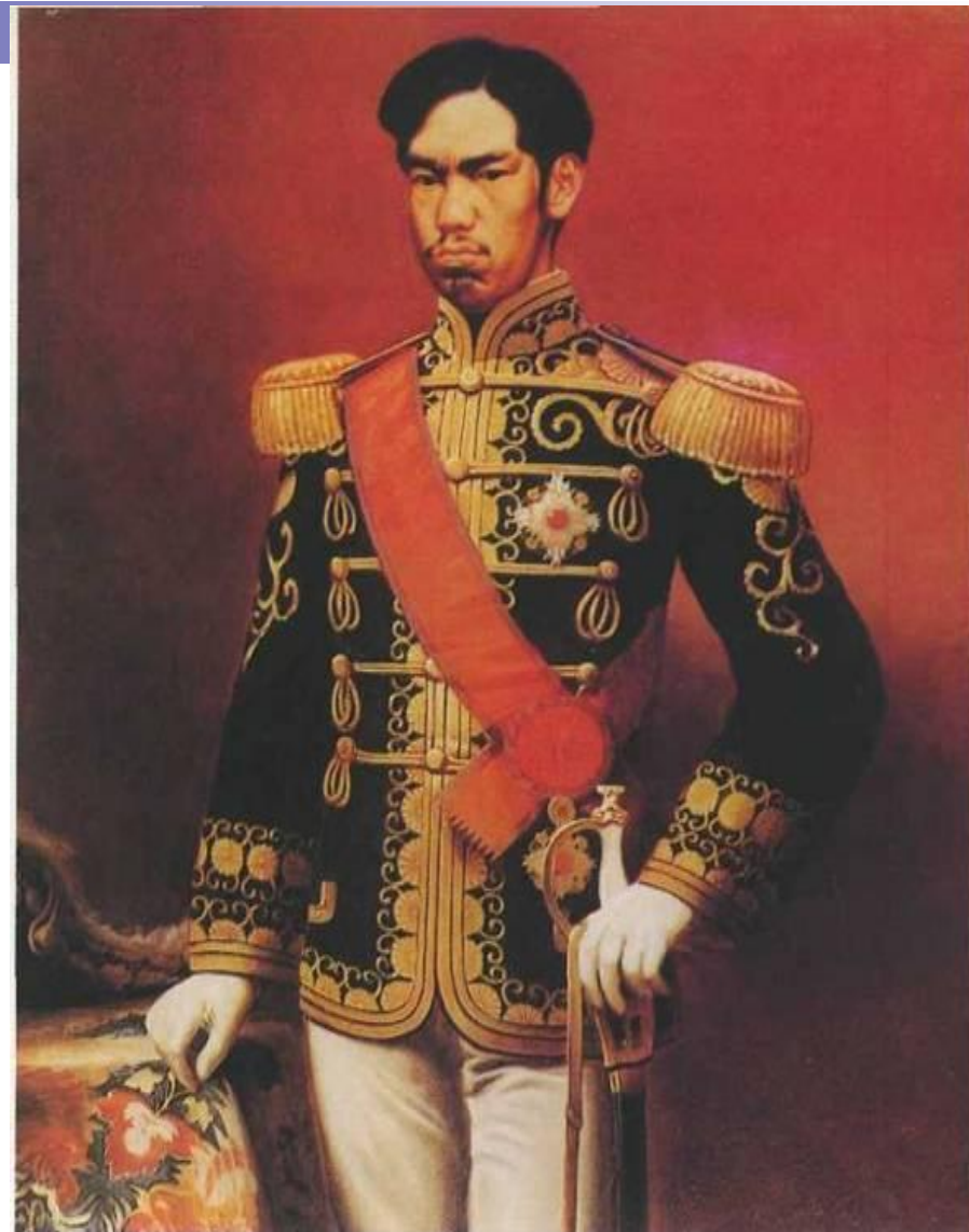
Император Муцухито (1852-1912)

За этот период Япония, ставшая к середине XIX века фактически полуколонией западных стран, единственная из стран Востока превратилась в передовую державу, которая сама приступила к колониальным захватам.