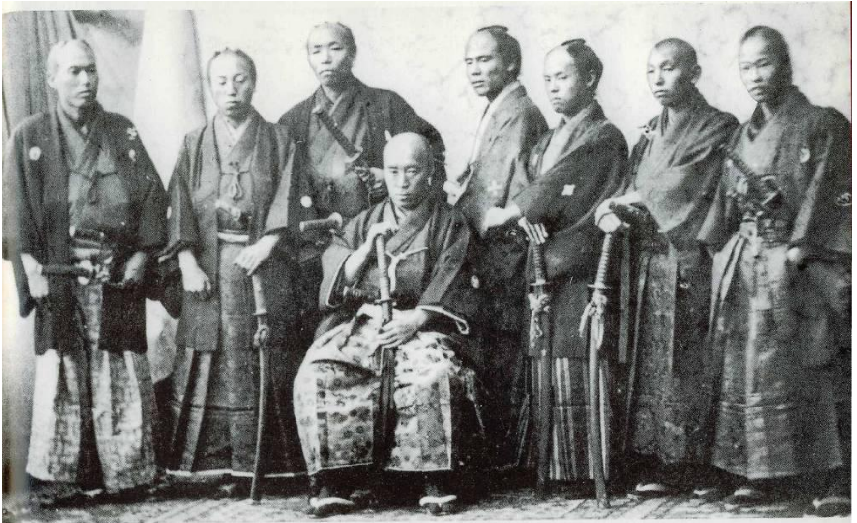
Делегация самураев в Европе (1862—1863). Посланники бакуфу должны были убедить Францию, Англию, Голландию, Пруссию и Россию в необходимости отложить на пять лет открытие для иностранцев новых гаваней и рынков на территории Японии.