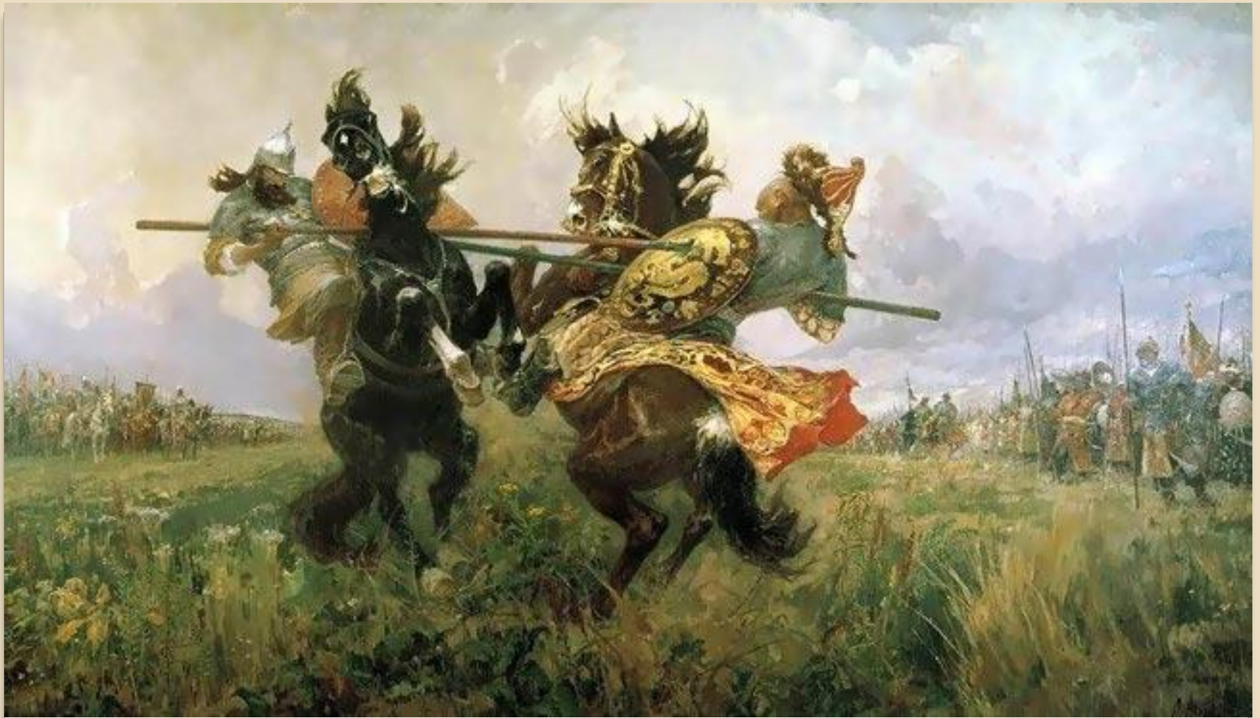
В. Васнецов «Поединок Пересвета с Челубеем»