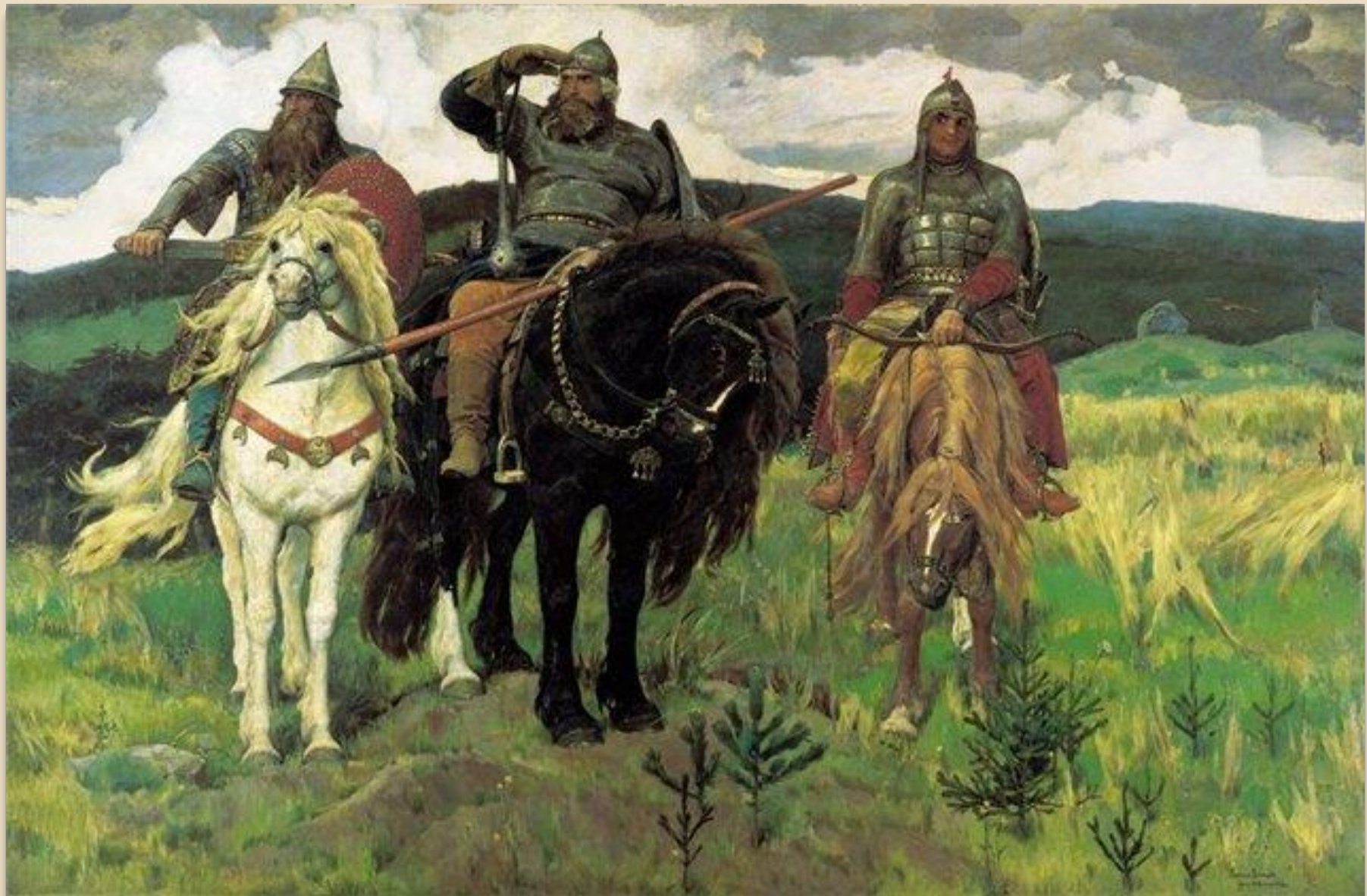
В. Васнецов «Богатыри»