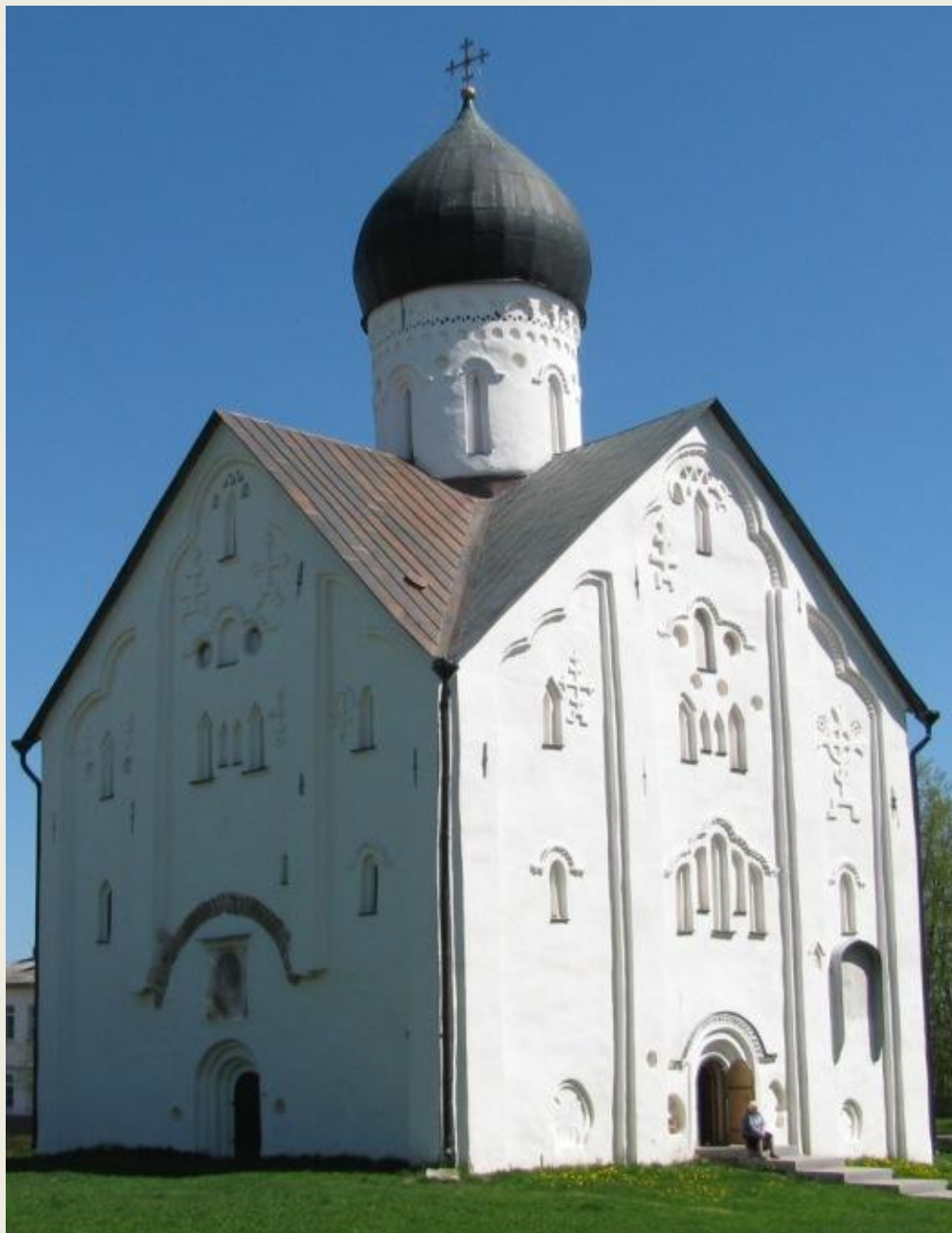
Церковь Спаса Преображения на Ильине улице Новгород