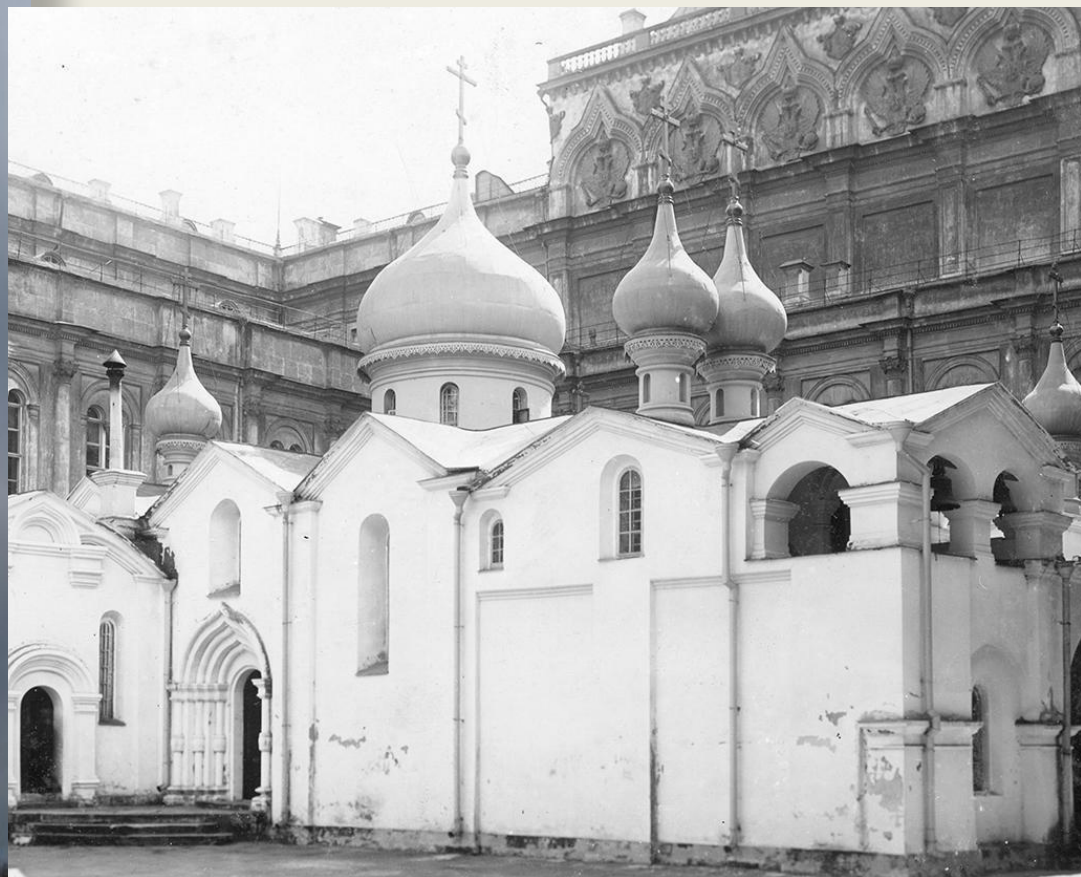
Церковь Спаса на Бору