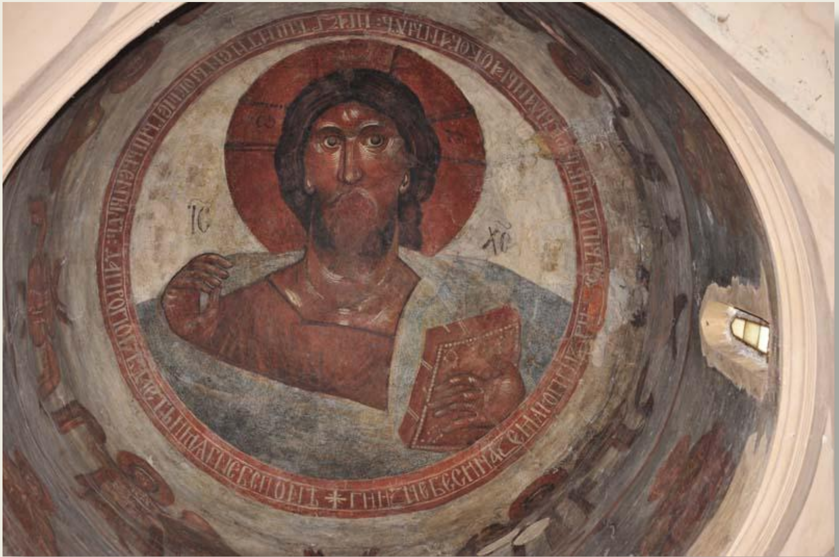
Спаситель Роспись купола церкви Спаса Преображения на Ильине улице в Новгороде