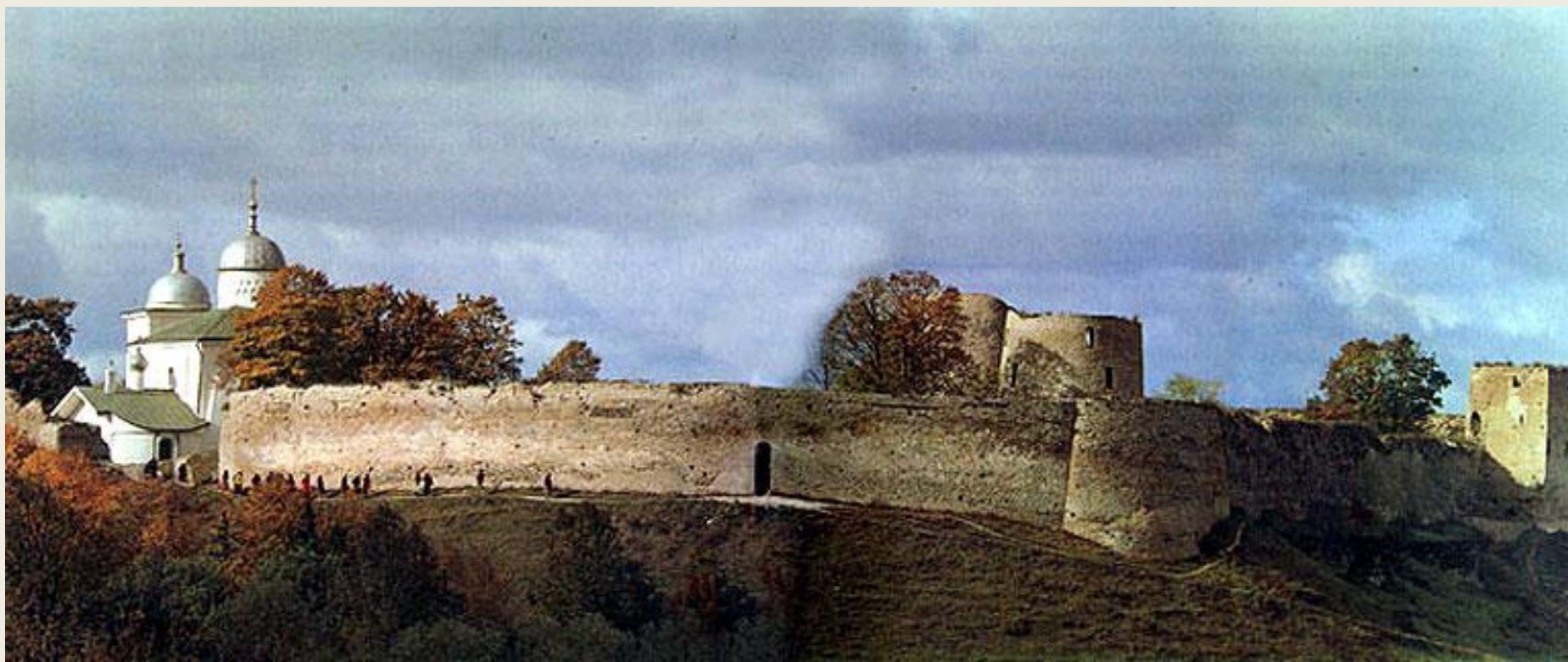
Крепость Изборск 1330г.