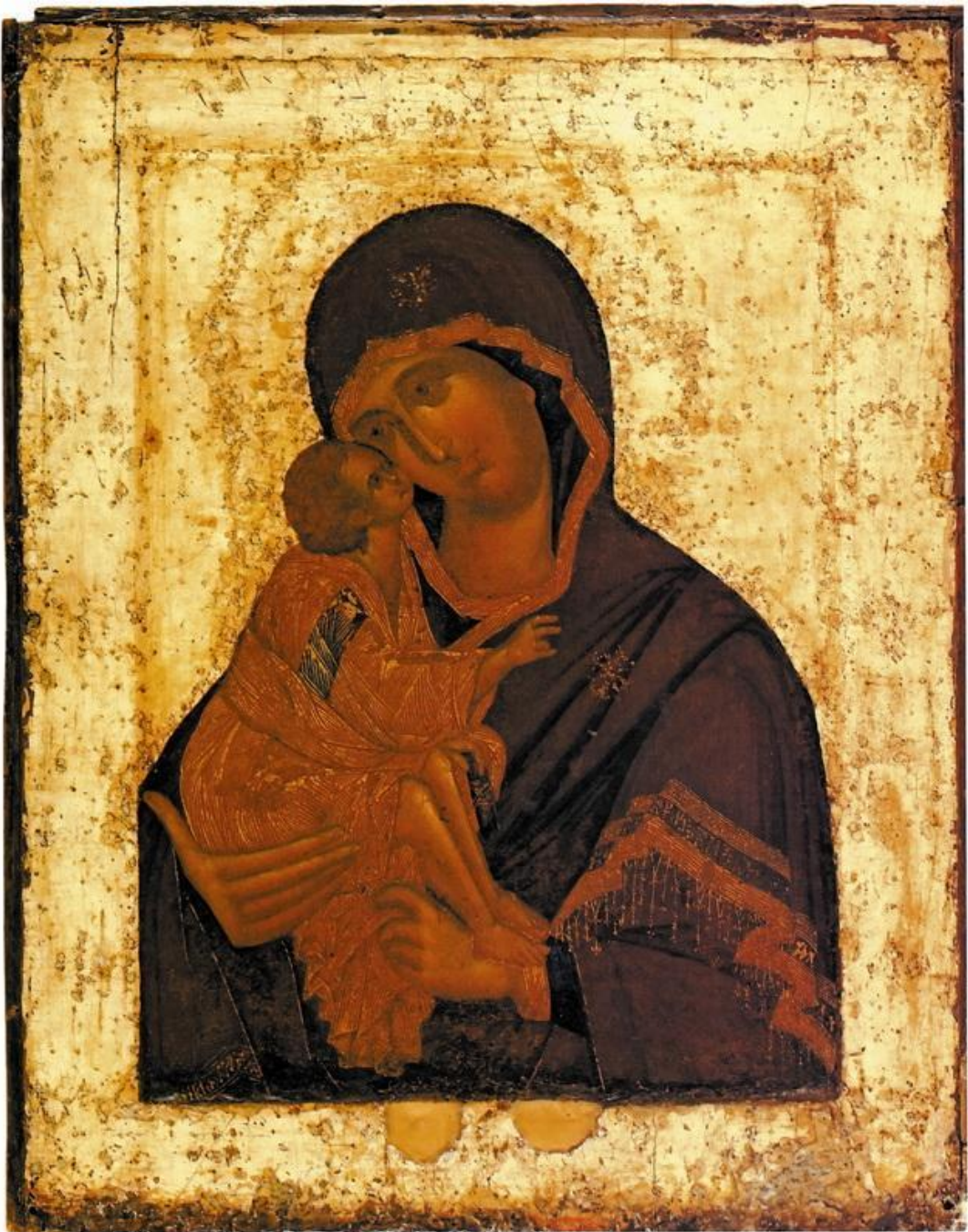
Икона Донской Божьей Матери