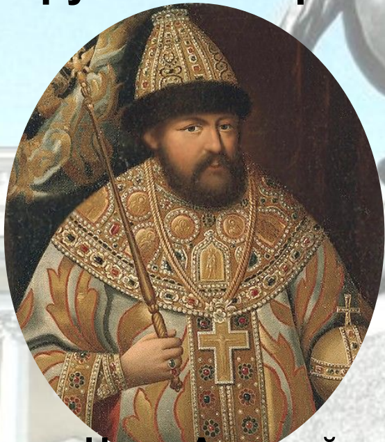
Царь Алексей Михайлович