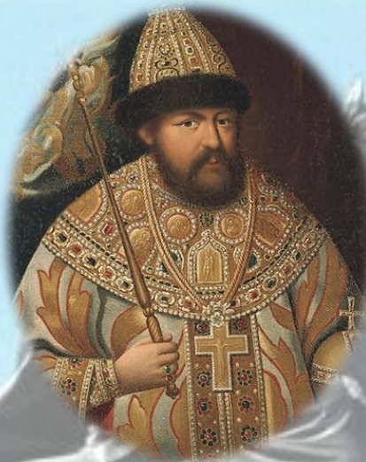
Царь Алексей Михайлович