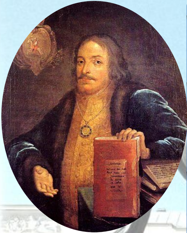
Василий Васильевич Голицын (1643—1714)