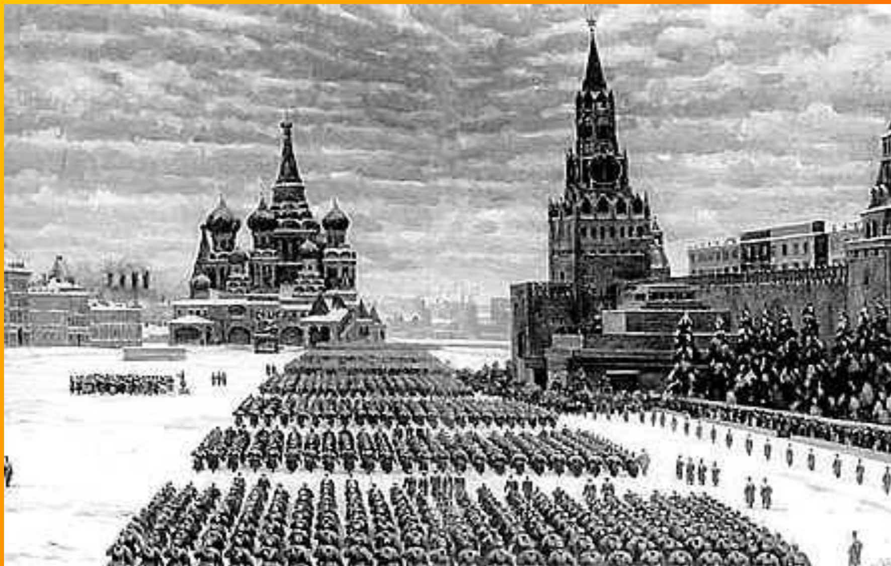
Парад на Красной площади в Москве 7 ноября 1941 года.