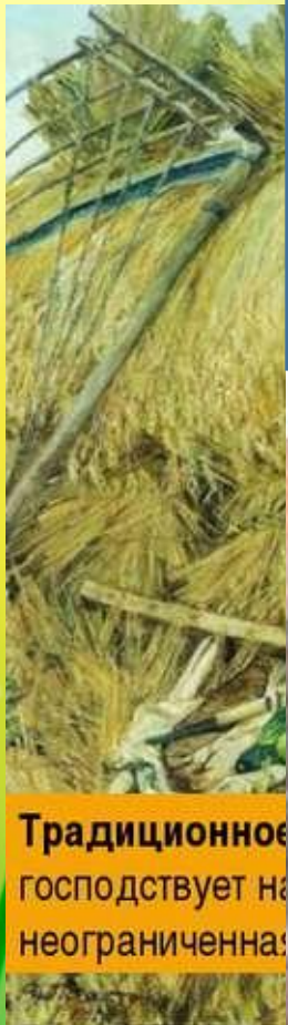
Традиционное господствует на неограниченна

Индустриальное общество характеризуется развитием разделения труда, массовым производством товаров, механизацией и автоматизацией производства, развитием средств массовой коммуникации, сферы услуг, высокой мобильностью и урбанизацией, возрастанием роли государства в регулировании социально-экономической сферы.