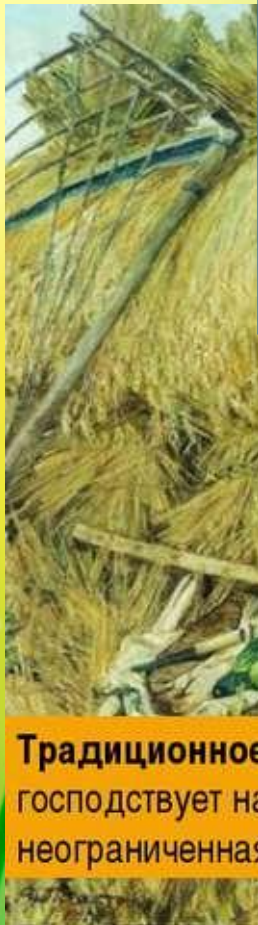
Традиционное господствует на неограниченна

Индустриальное общество характеризуется развитием разделения труда, массовым производством товаров, механизацией и автоматизацией производства, развитием средств массовой коммуникации, сферы услуг, высокой мобильностью и урбанизацией, возрастанием роли государства в регулировании социально-экономической сферы.