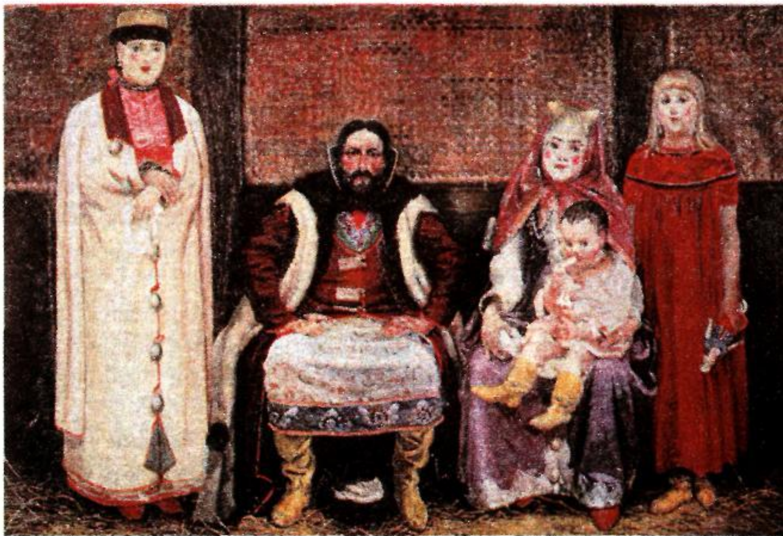
Семья купца XVII в. Художник А. Рябушкин.