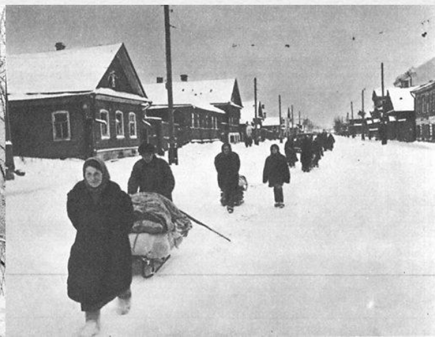
На улицах освобождённого Калинина