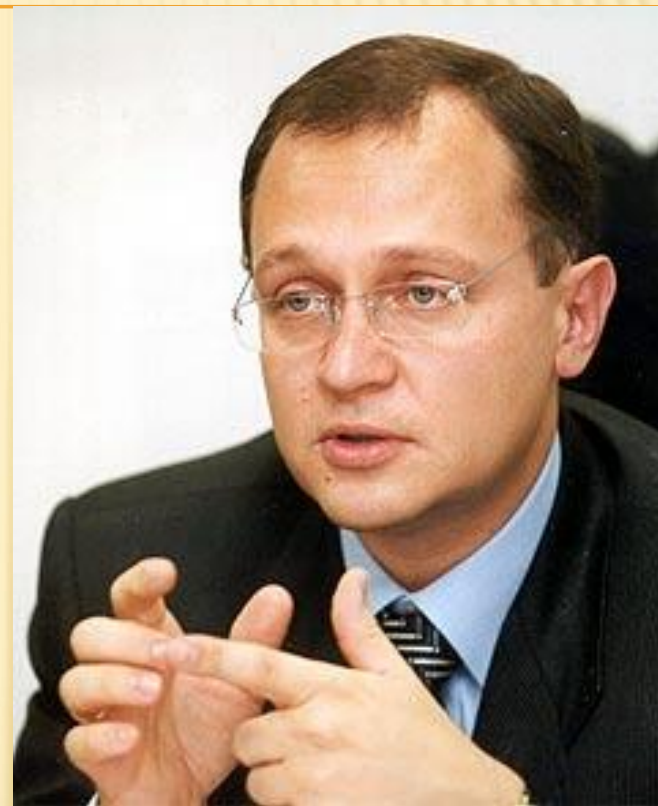
Сергей Владиленович Кириенко, Премьер-министр

Курс рубля к доллару к осени 1998 г. снизился в четыре раза.