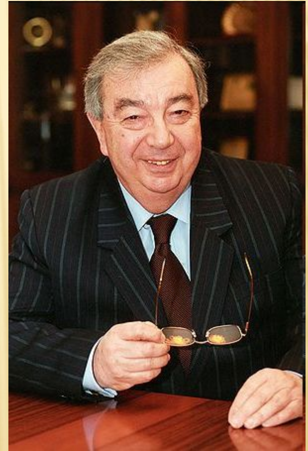
Евгений Максимович Примаков, Премьер-министр

Удалось вдвое снизить государственные расходы и выйти в профицит бюджета