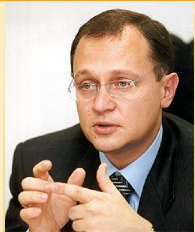
Сергей Владименович Кириенко, Премьер-министр

Курс рубля к доллару к осени 1998 г. снизился в четыре раза.