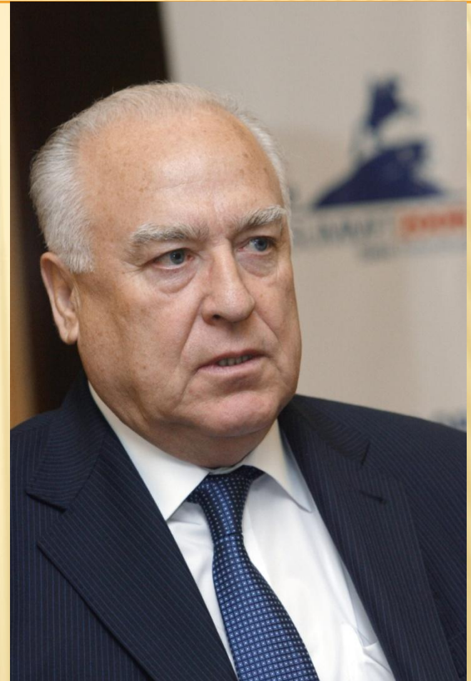
Виктор Степанович Черномырдин, Премьер-министр

Кредиты Международного валютного фонда и Всемирного банка