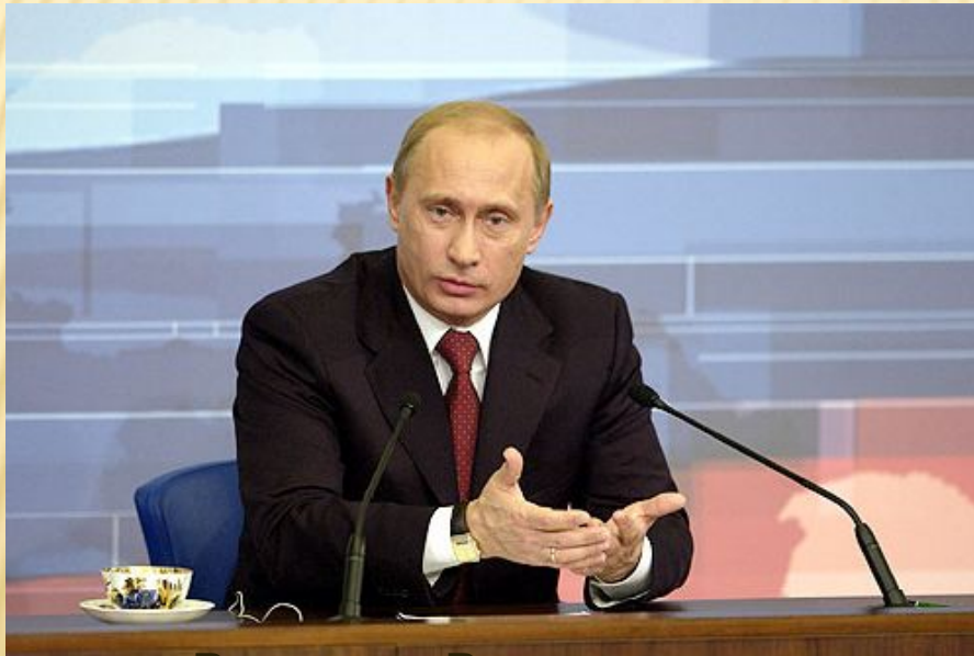
Владимир Владимирович Путин, Премьер-министр

Началась разработка новых подходов к экономическому развитию страны