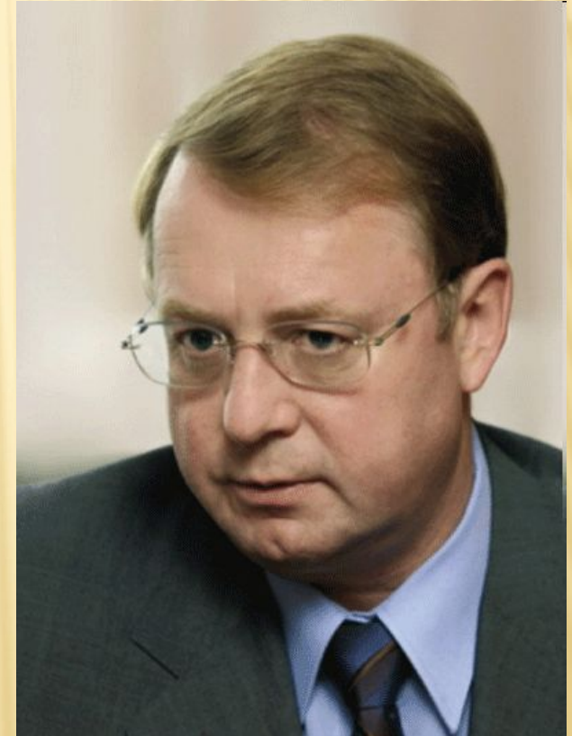
Сергей Вадимович Степашин, Премьер-министр