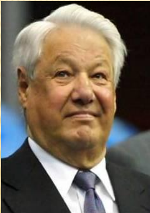
Борис Николаевич Ельцин, Президент РСФСР