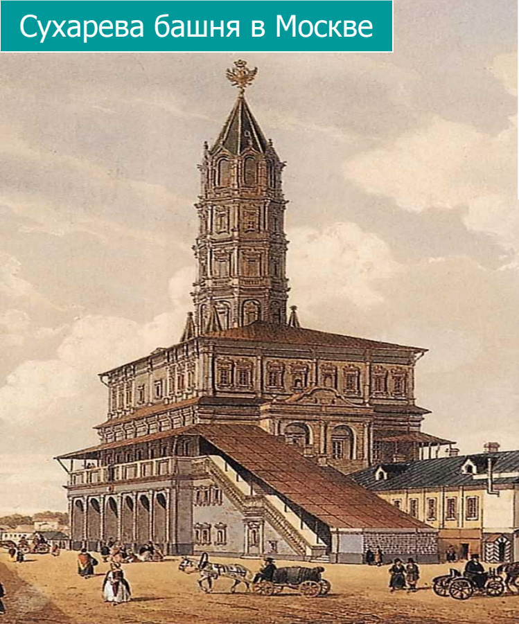
Сухарева башня в Москве