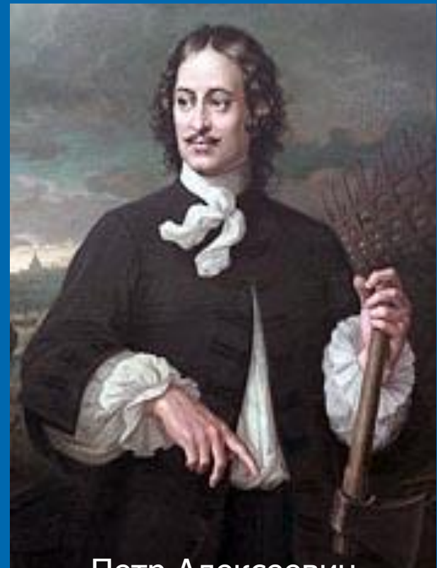
Петр Алексеевич Романов 1672-1725 гг.

- Споры о Петре ведутся сейчас, велись раньше, и будут вестись всегда – всегда, пока живут люди, неравнодушные к истории нашей страны.