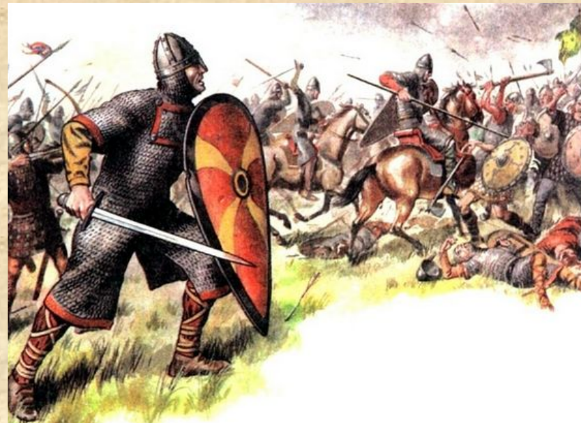
Битва при Гастингсе