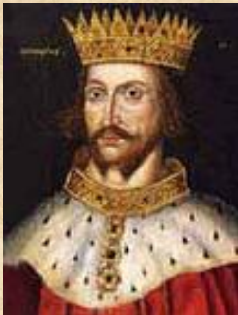
Генрих II Плантагенет