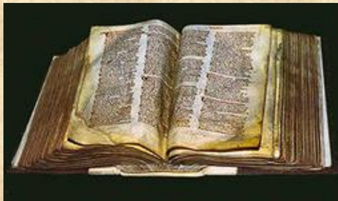
«Книга страшного суда»