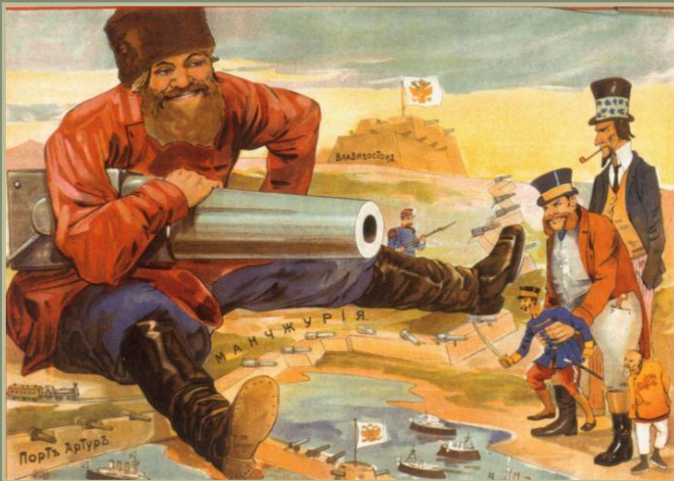
Карикатура времен русско-японской войны