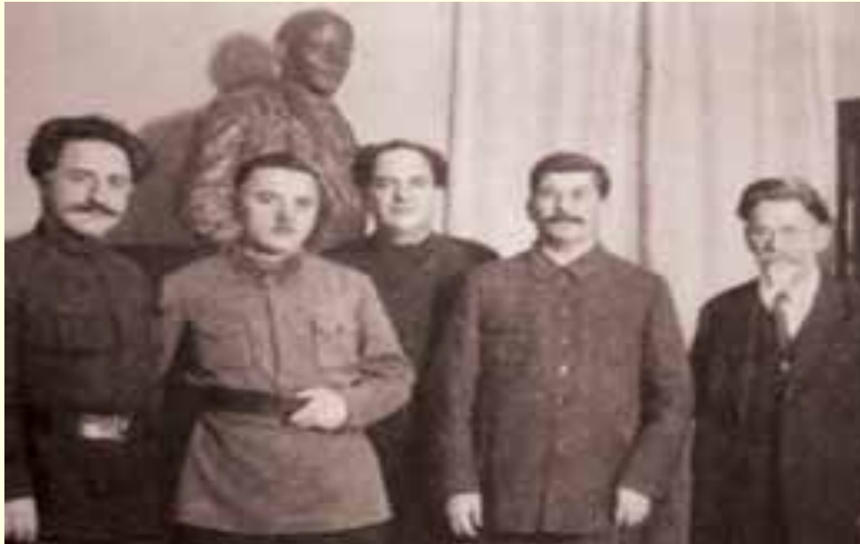
Руководители Советского правительства: Г.К. Орджоникидзе, К.Е. Ворошилов, В.В. Куйбышев, И.В. Сталин, М.И. Калинин. 1929 год