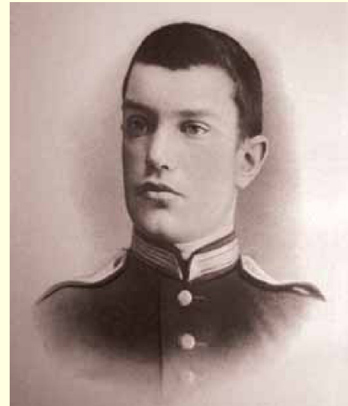
Семья Куйбышевых. Валериан Куйбышев, 1904 год