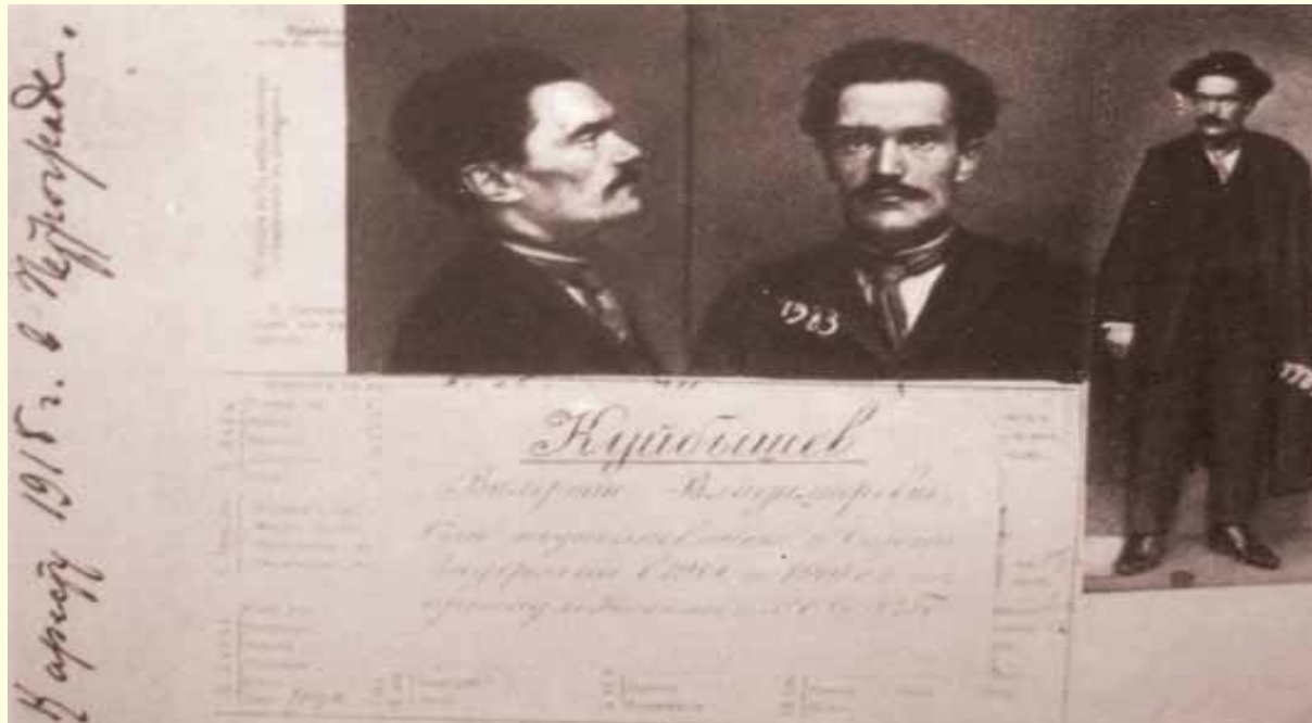
Материалы дела В.В. Куйбышева. Петербург, 1915 год