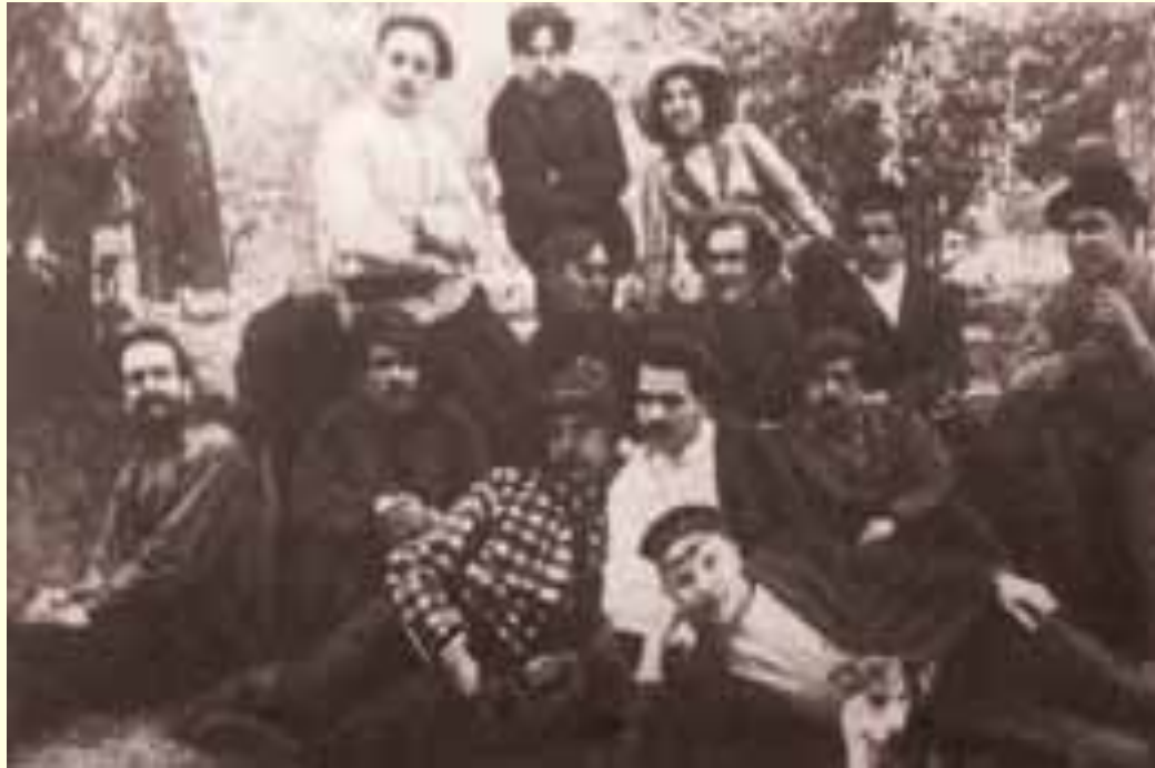
Валериан Куйбышев (во втором ряду третий справа) в Нарымской ссылке. 1911*1912 годы