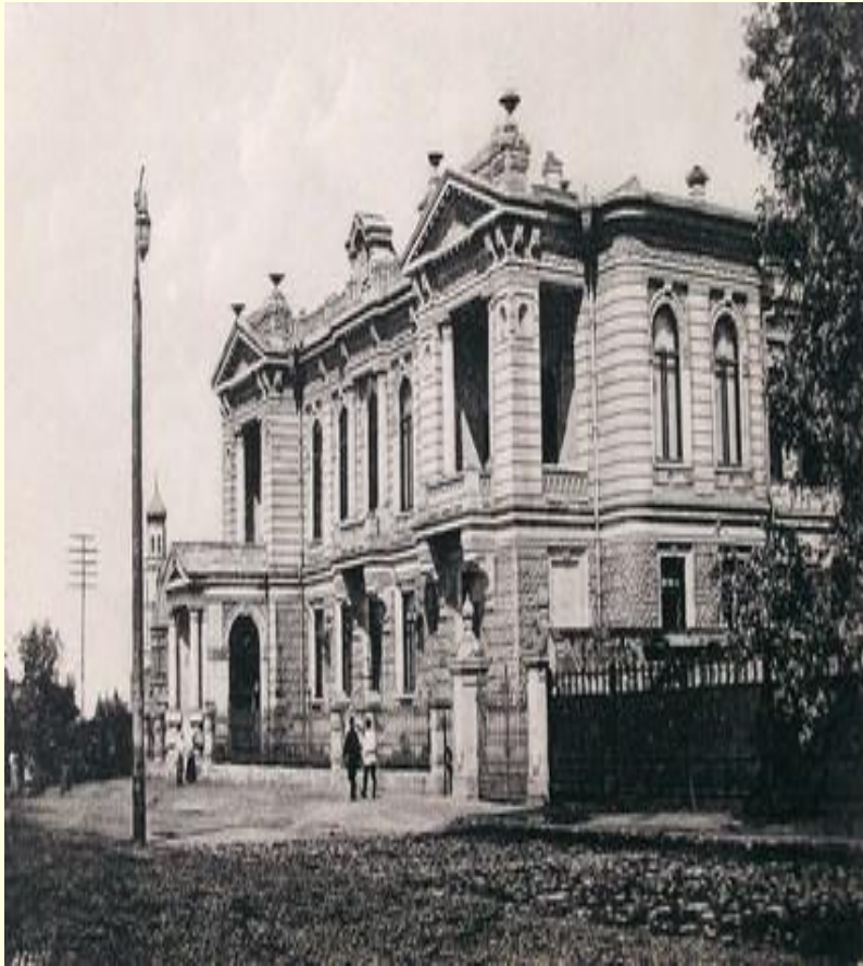
Улица Куйбышева (Дворянская), 151. На заднем плане видна звонница Иверского монастыря