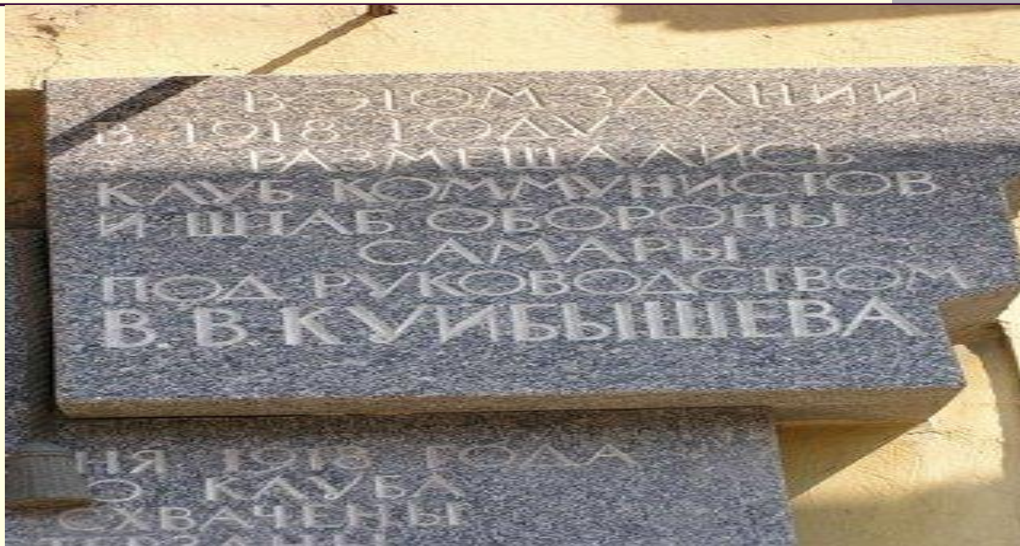
Доска установлена по адресу: ул. Венцека, 48.