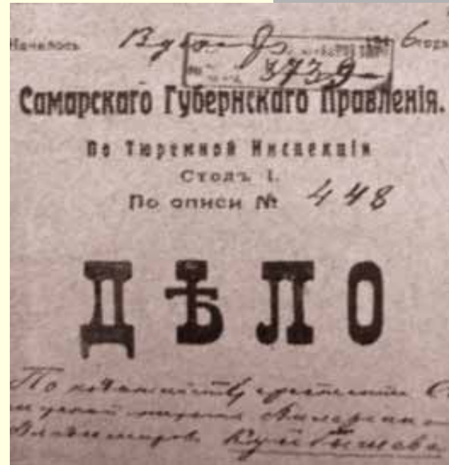
Дело заключенного Самарской губернской тюрьмы В.В. Куйбышева. 1916 год