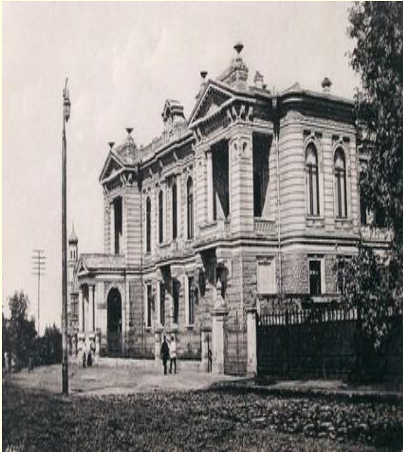
Улица Куйбышева (Дворянская), 151. На заднем плане видна звонница Иверского монастыря