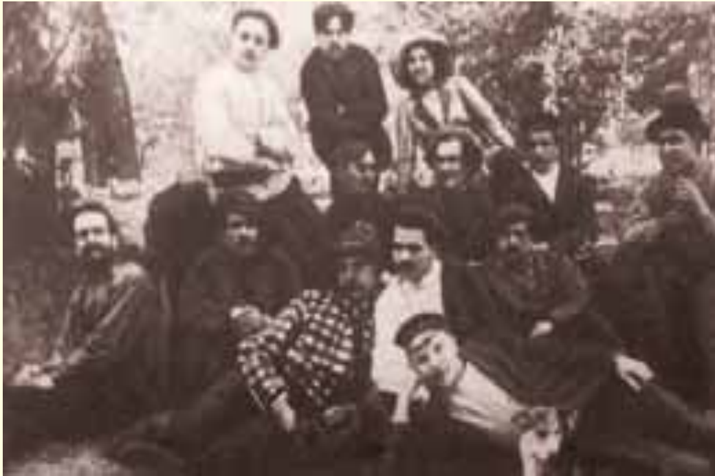
Валериан Куйбышев (во втором ряду третий справа) в Нарымской ссылке. 1911*1912 годы