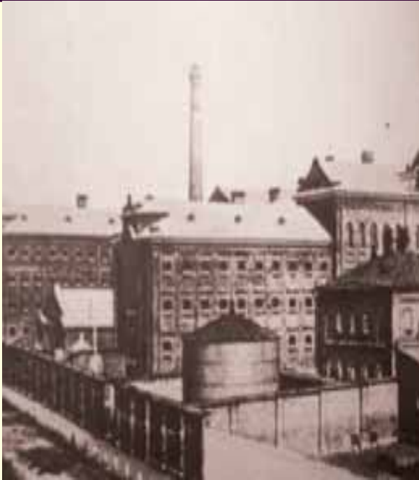
Самарская губернская тюрьма. 1916 год