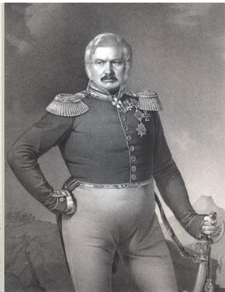
Министр земледелия С. Ермолов