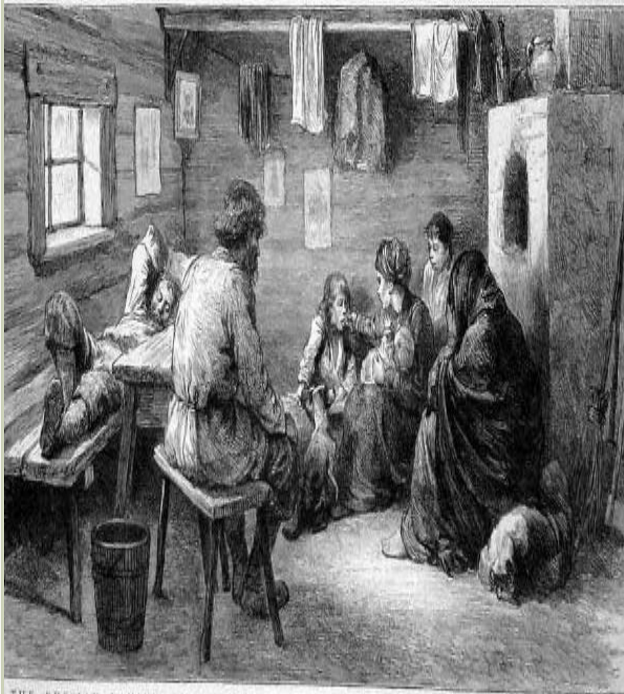
THE RUSSIAN FAMINE—THE INTERIOR OF A COTTAGE IN THE DISTRESSED DISTRICTS