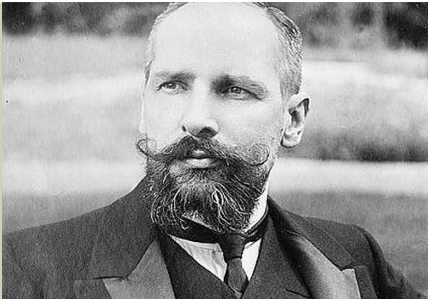
Премьер Министр П.А. Столыпин