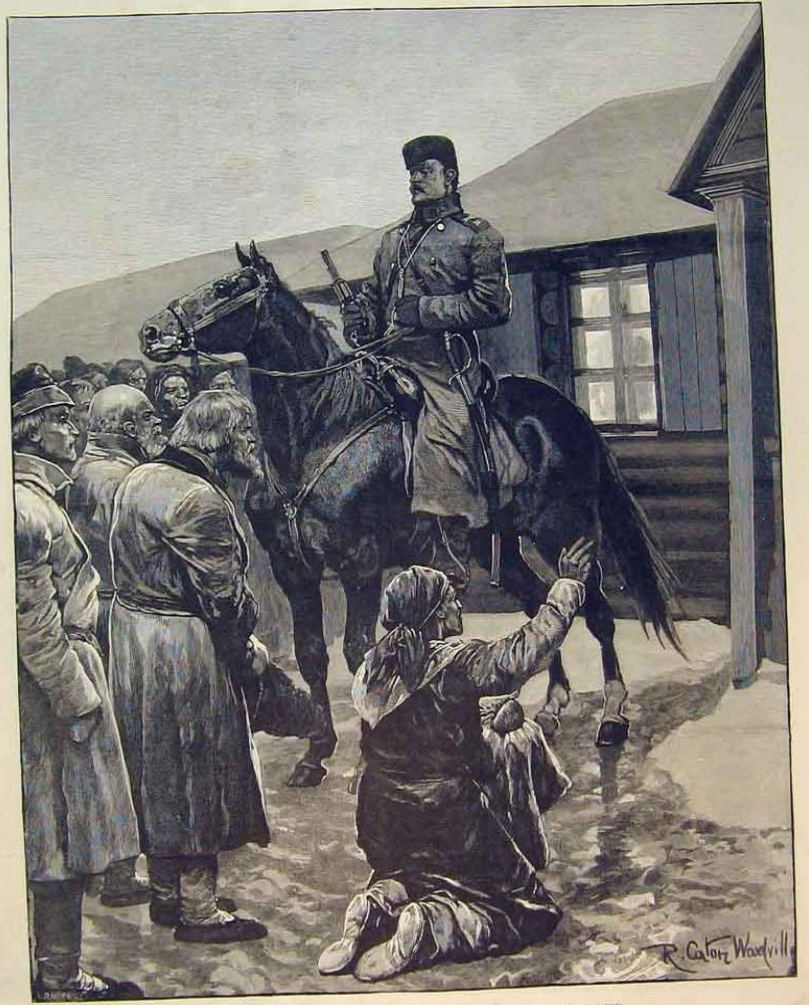
THE FAMINE IN RUSSIA. BEGGING FOR BREAD AT THE MAYOR'S HOUSE, NEAR SIMBIRSK. FROM A SKETCH BY A RUSSIAN OFFICER.