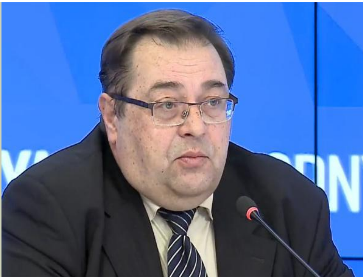
Директор Института российской истории РАН