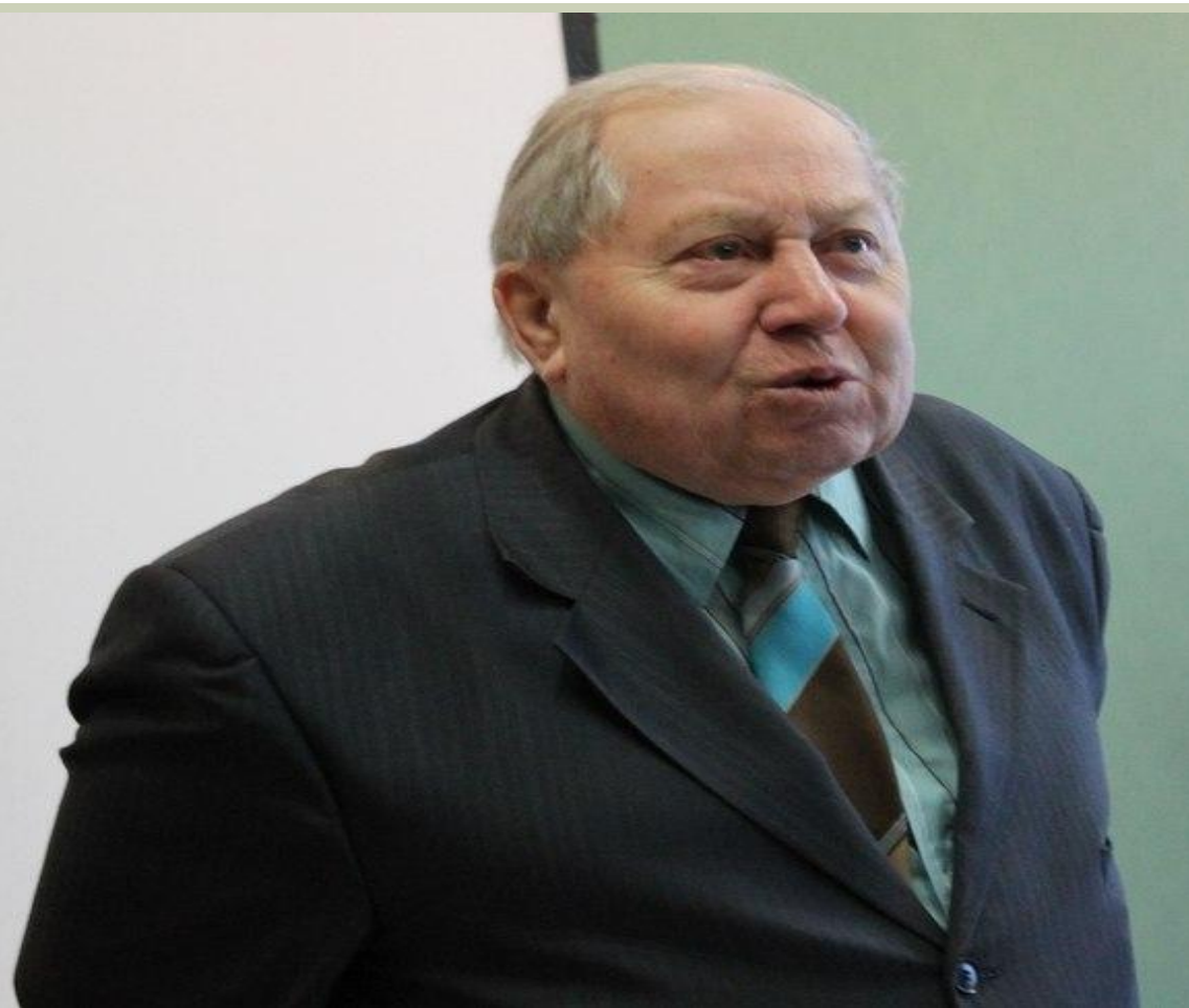
Профессор факультета политологии МГУ