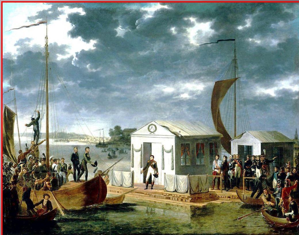
Встреча Наполеона и Александра I на реке Неман

25 июня 1807 г. состоялась встреча Наполеона и Александра I на реке Неман. После двух недель переговоров был подписан мирный договор. Россия признавала все завоевания Франции, присоединялась к континентальной блокаде и становилась военным союзником Франции.