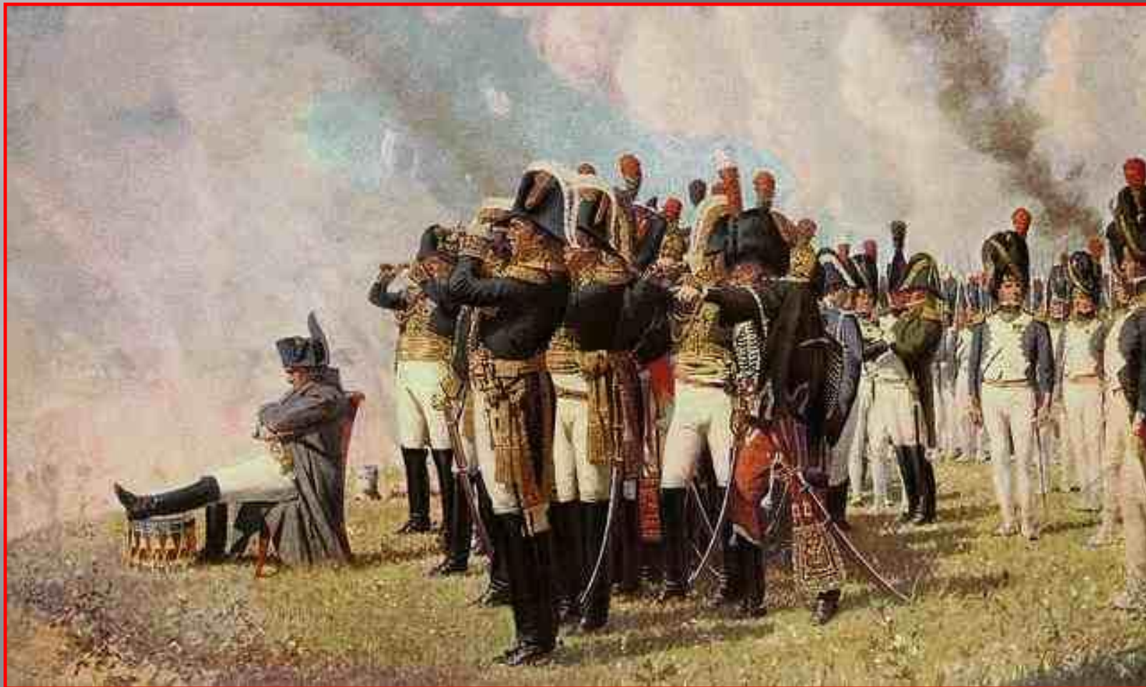
Наполеон на Бородинском поле

7 сентября 1812 г. в 120 км. от Москвы у дер.Бородино произошло генеральное сражение. После сражения М. И.Кутузов принял решение оставить Москву без боя.