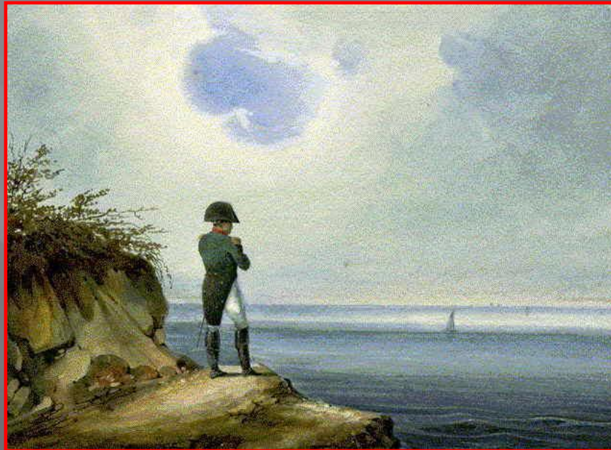
Наполеон Бонапарт на о. Святой Елены