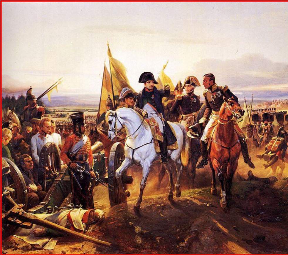
Наполеон после победы в битве при Фридланде

В 1807 г. войска Наполеона дважды разбили русские армии в Восточной Пруссии. Россия, воевавшая одновременно с Турцией и Ираном, оказалась в сложном положении. Александр I принял решение пойти на мир с Наполеоном.