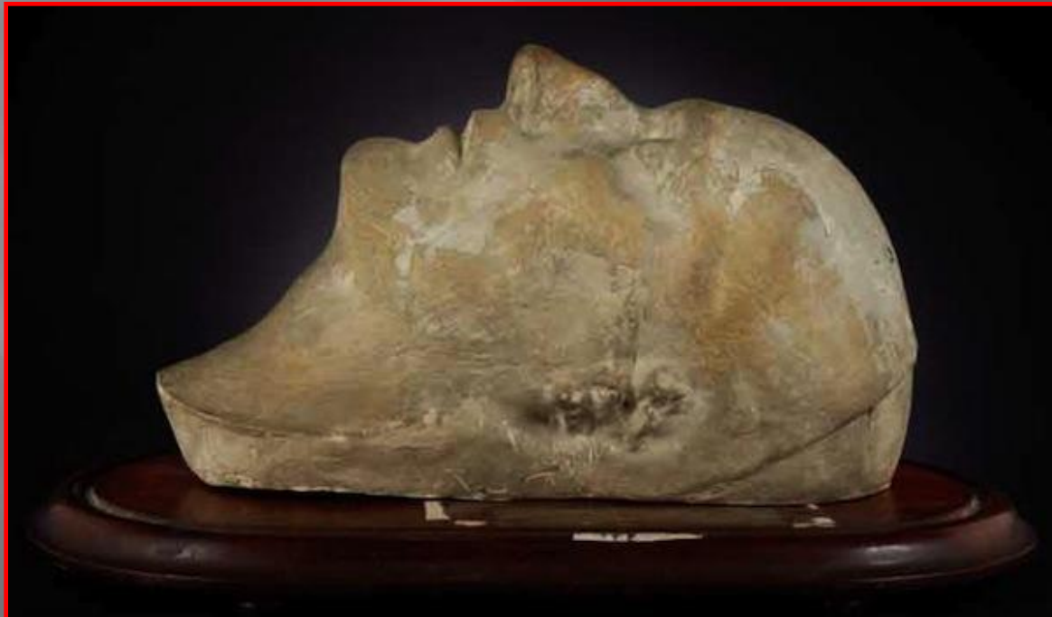
Посмертная маска Наполеона Бонапарта