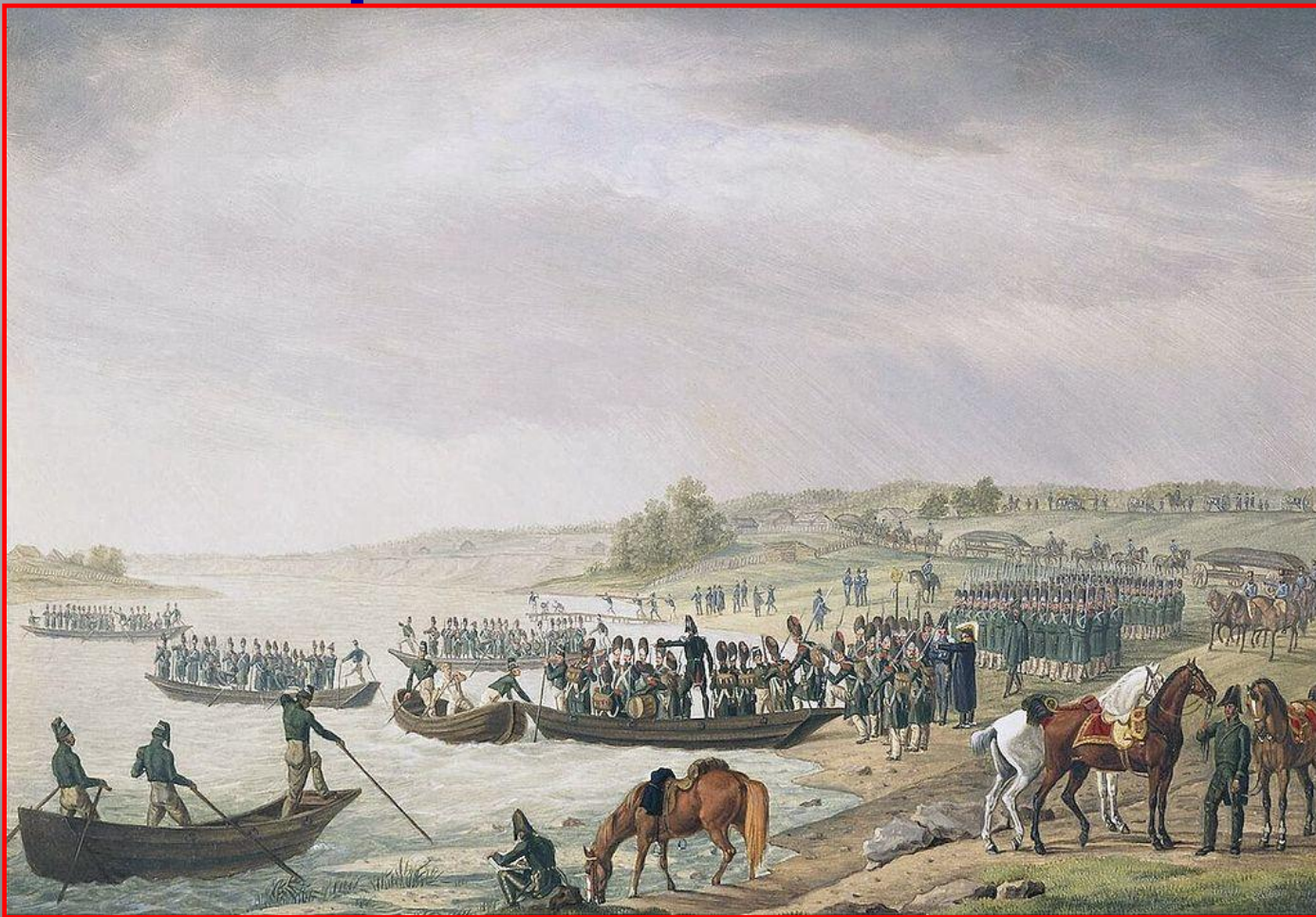
Переправа войск Наполеона через Неман

24 июня 1812 г. французская армия и союзники («Великая армия», до 640 тыс.чел.) под командованием Наполеона вторглись на территорию России.