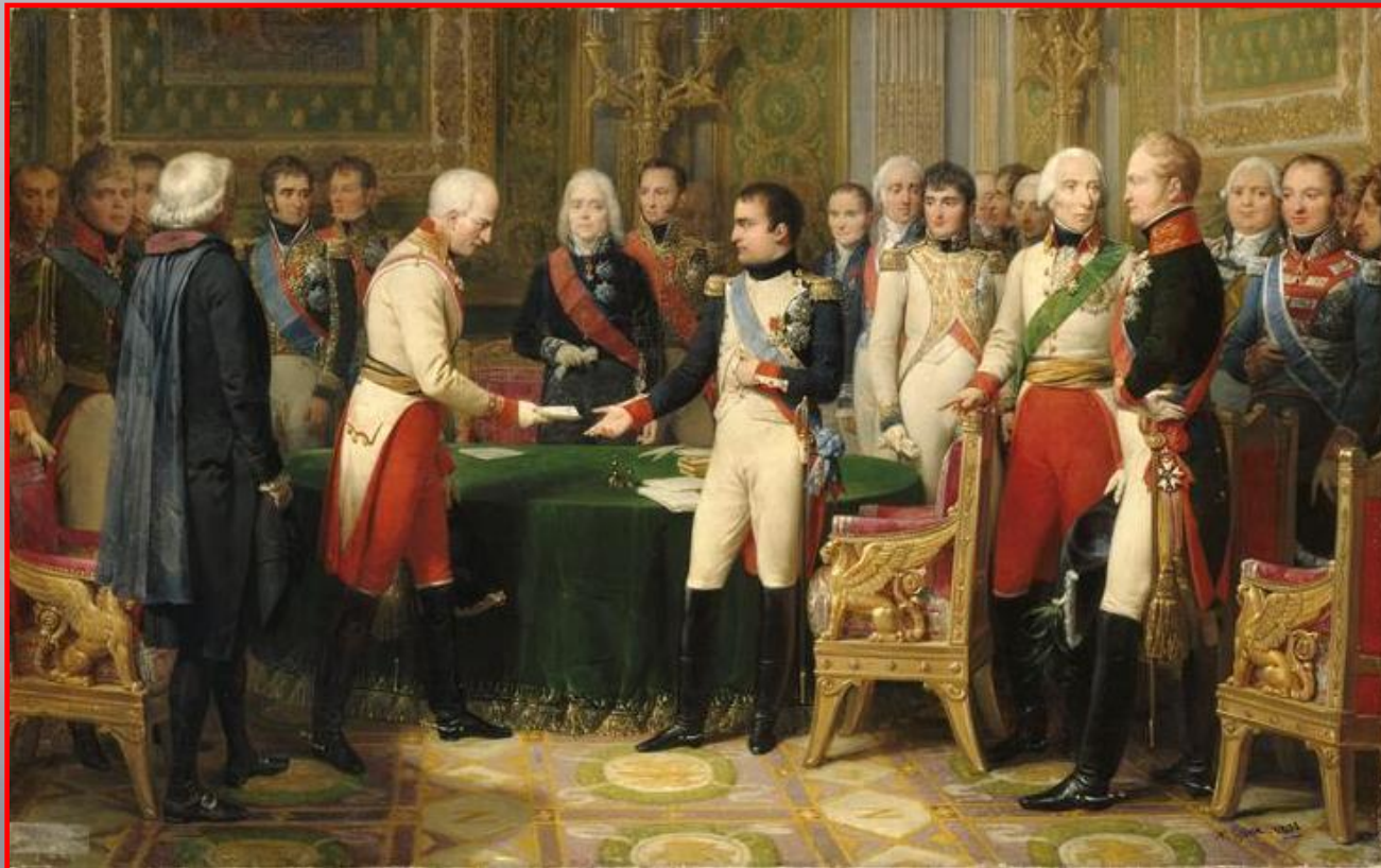
Встреча Наполеона и Александра I в Эрфурте

Противоречия между Францией и Россией сохранялись и обострялись. В 1808 г. произошла новая встреча Наполеона и Александра I в Эрфурте. Несмотря на демонстрацию дружеских отношений, Александр отказал Наполеону в помощи против Австрии. Обострение отношений вело к войне.