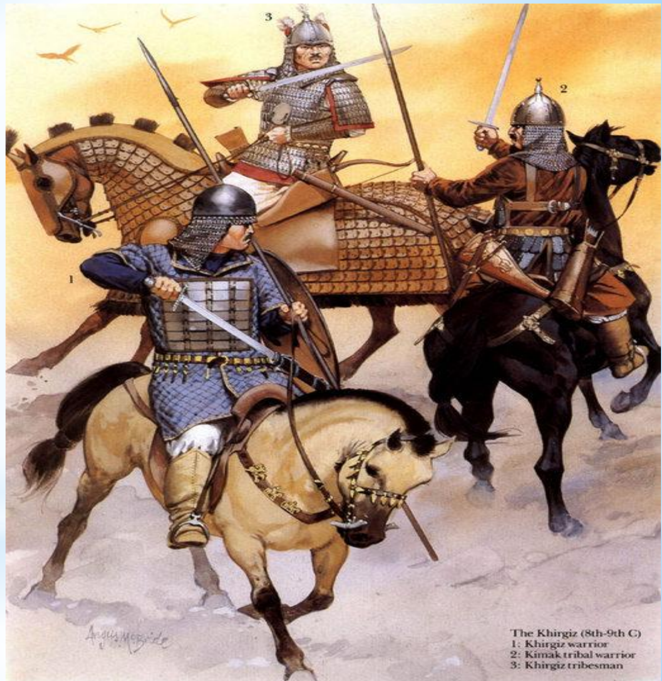
The Khirgiz (8th-9th C) 1: Khirgiz warrior 2: Kimak tribal warrior 3: Khirgiz tribesman

Тюркоязычные народы известны с III в. до н. э., но первые упоминания этнонима тюрк (китайское название ту-кю) появились в начале VI в. в Монгольском Алтае и относилось к небольшому народу, впоследствии ставшим доминирующим в Срединной Азии. Слово тюрк значит сильный, крепкий