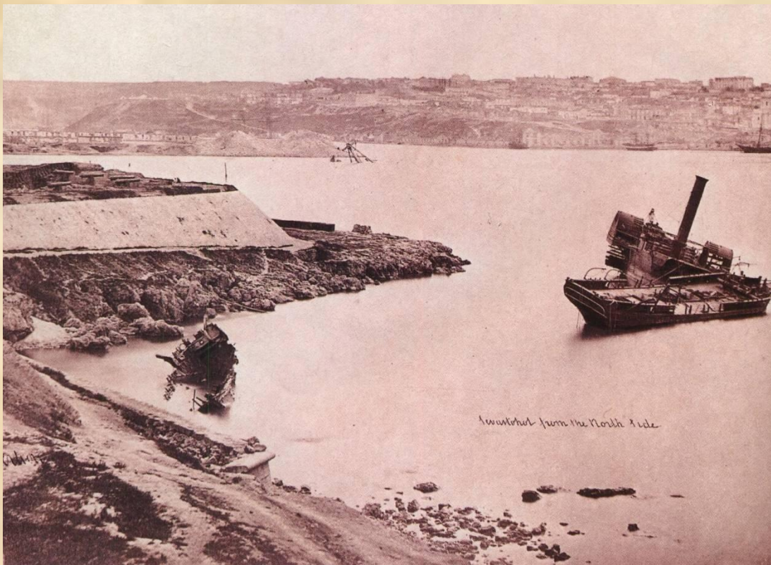
Вид с Северной стороны на Южную после взятия Севастополя.

Защитники города уничтожили батареи, пороховые погреба, потопили часть оставшихся кораблей и переправились на Северную сторону.