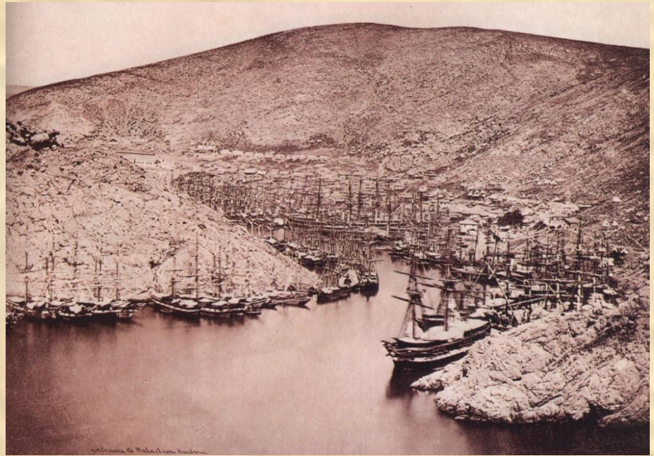
Английский и французский флоты в Балаклаве