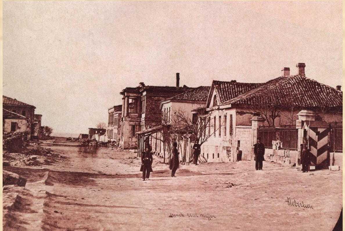
Одна из улиц Севастополя разрушенная бомбардировкой.

Войска противника несколько раз штурмовали город. Город был засыпан бомбами и ракетами. Защитники не могли отвечать огнём такой же силы, так как боеприпасов не хватало. Кровопролитная борьба развернулась за Малахов курган. 12 июля 1855г. Во время обороны Малахова кургана погиб адмирал Нахимов.