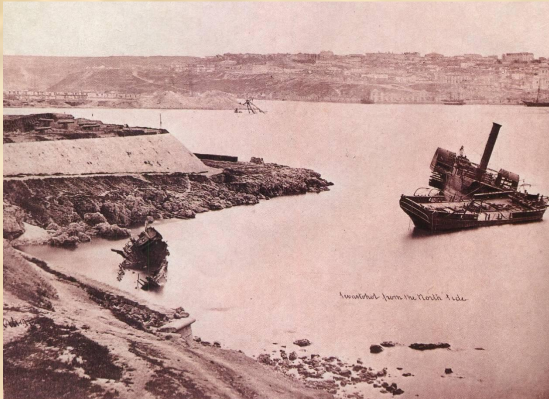
Вид с Северной стороны на Южную после взятия Севастополя.

5 – 24 августа 1855 г. Противник выпустил по Севастополю около 200 тыс. снарядов. В результате город был полностью разрушен. Противнику удалось захватить Малахов курган, что и решило исход обороны Севастополя. Защитники города уничтожили батареи, пороховые погреба, потопили часть оставшихся кораблей и переправились на Северную сторону.