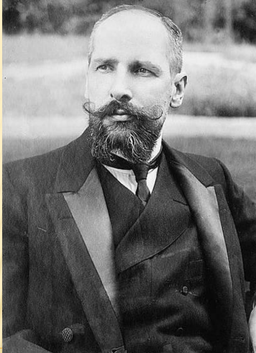
ПЕТР АРКАДЬЕВИЧ СТОЛЫПИН