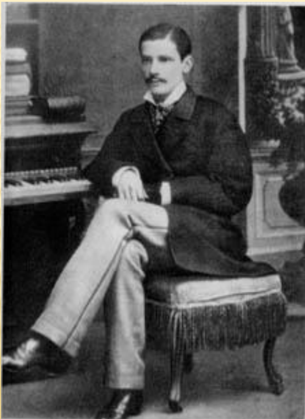
П.А. Столыпин - студент Санкт- Петербургского университета. 1884 г.