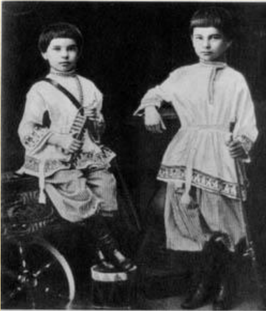
П.А. Столыпин в 7 лет. С братом А.А. Столыпиным.1869 г.

Петр Столыпин родился 14 апреля 1862 года в столице Саксонии Дрездене.