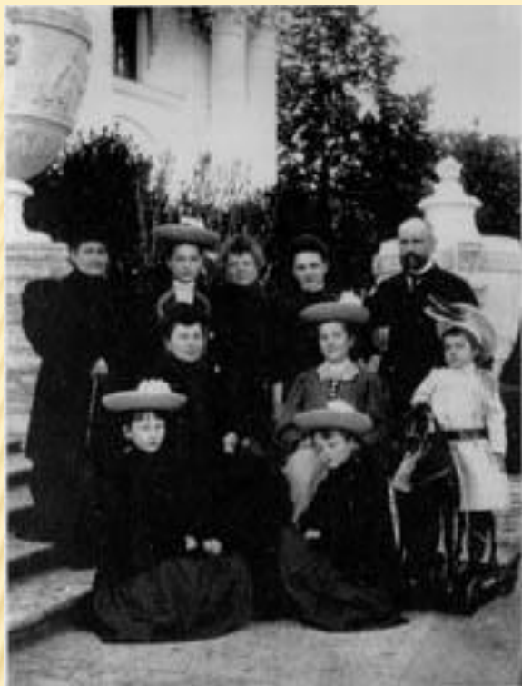
С семьей на террасе Елагинского дворца. 1907 г.