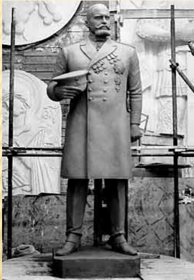
Памятник Столыпину в Саратове