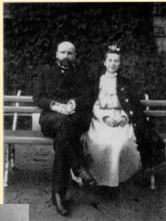
П.А. Столыпин с дочерью Натальей Петровной