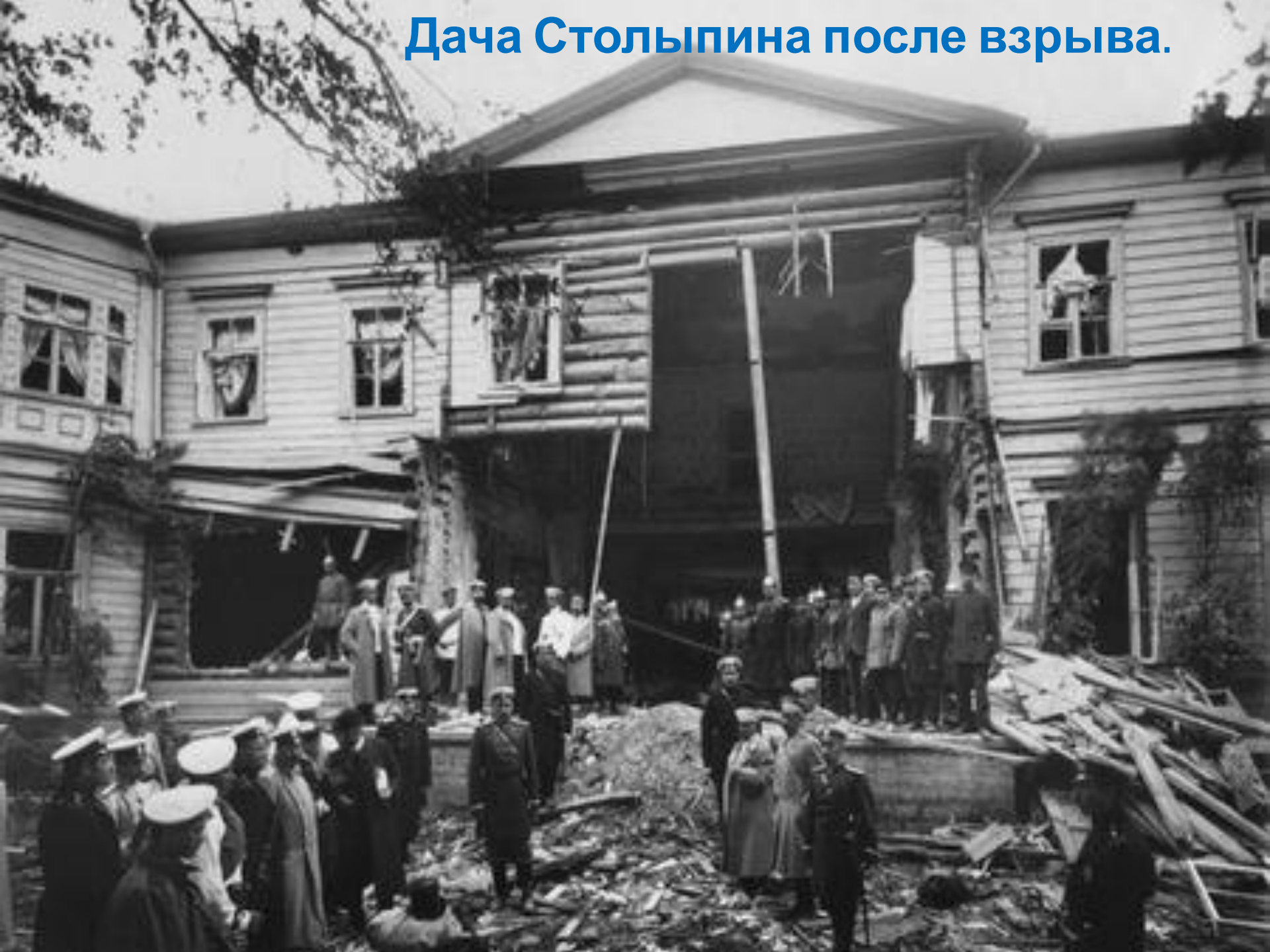
Дача Столыпина после взрыва.