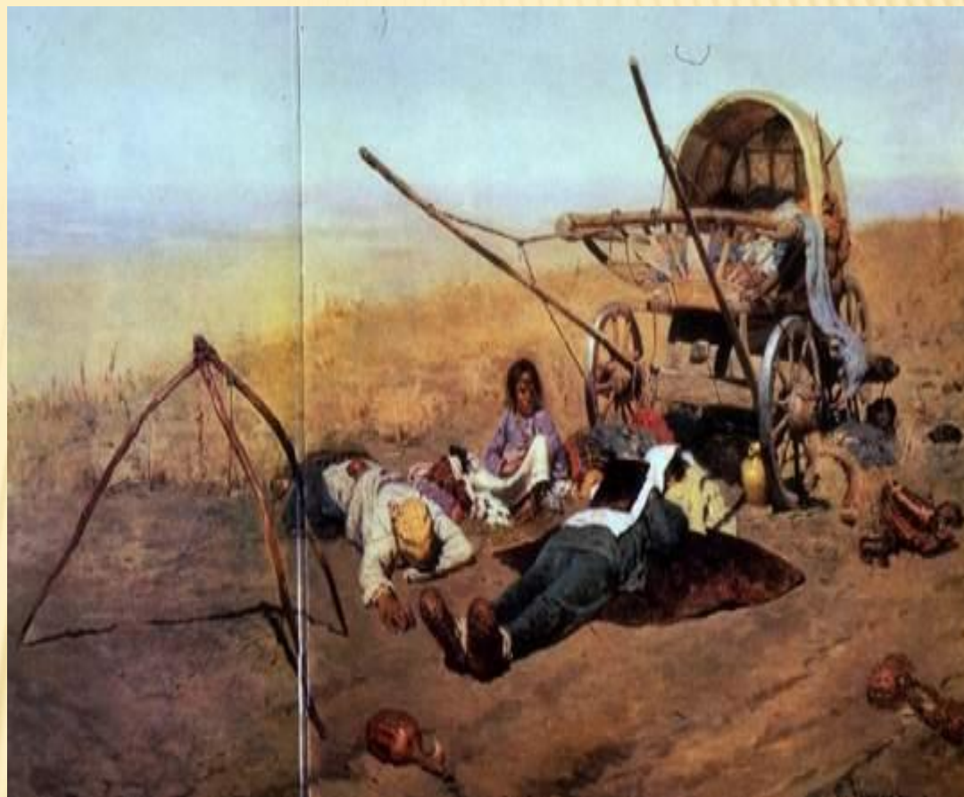
«В ДОРОГЕ...СМЕРТЬ ПЕРЕСЕЛЕНЦА»

5. Столыпинская аграрная реформа была сопряжена с определенным насилием по отношению к общинникам, с ней не согласным.