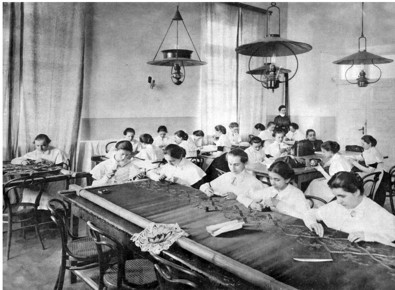
Институт благородных девиц

В 1730-1755 годах возникают дворянские учебные заведения. Сухопутный корпус, Морской, инженерный. Был также создан Смольный институт благородных девиц. Вместе с этим, начинали формироваться основы общественного образования, ревнителем которых был Михаил Васильевич Ломоносов. В провинциях развивались епархиальные и адмиралтейские школы. В Москве и Петербурге появляются первые общеобразовательные гимназии.