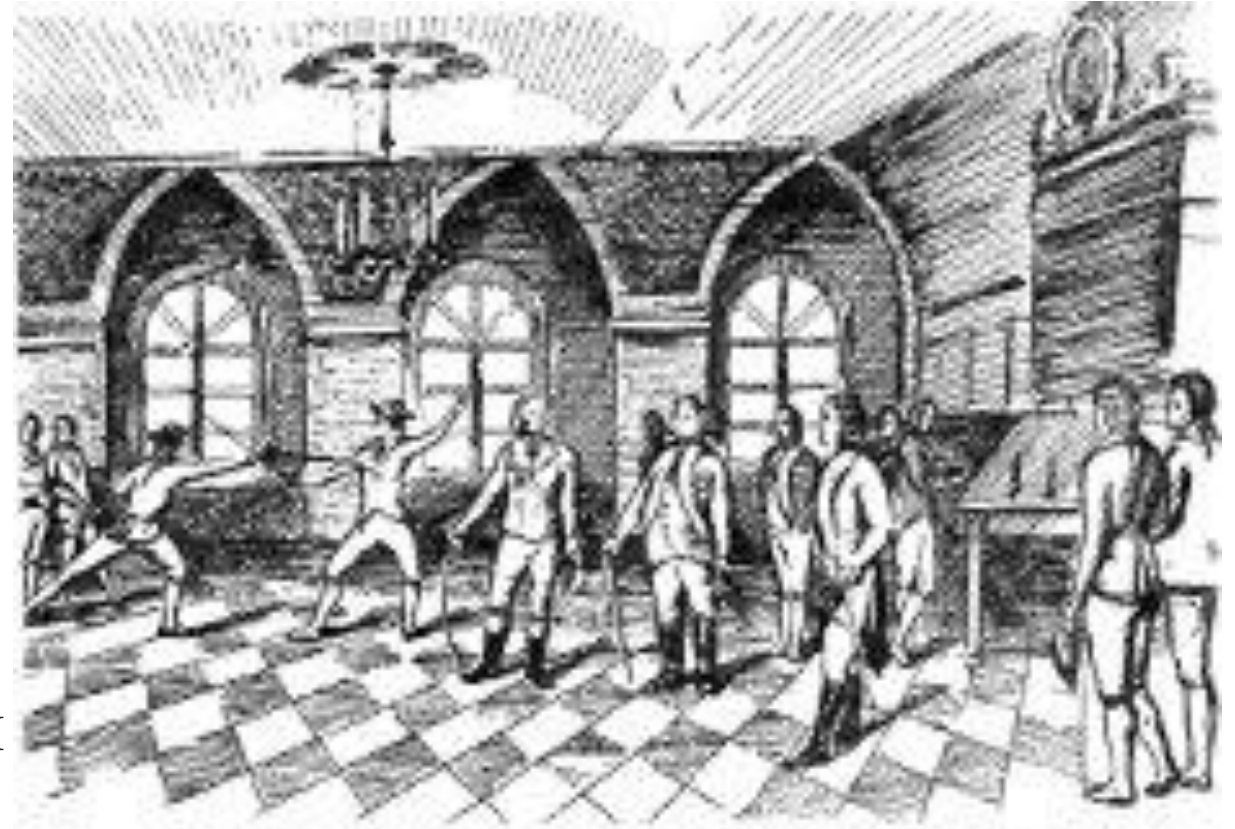
Рис. 23. Урок фелтования на ратрах в петербургское время

В 1715 г. старшие классы Школы математических и навигационных наук были переведены в Петербург и преобразована в Морскую академию (ныне Высшая военно-морская академия).