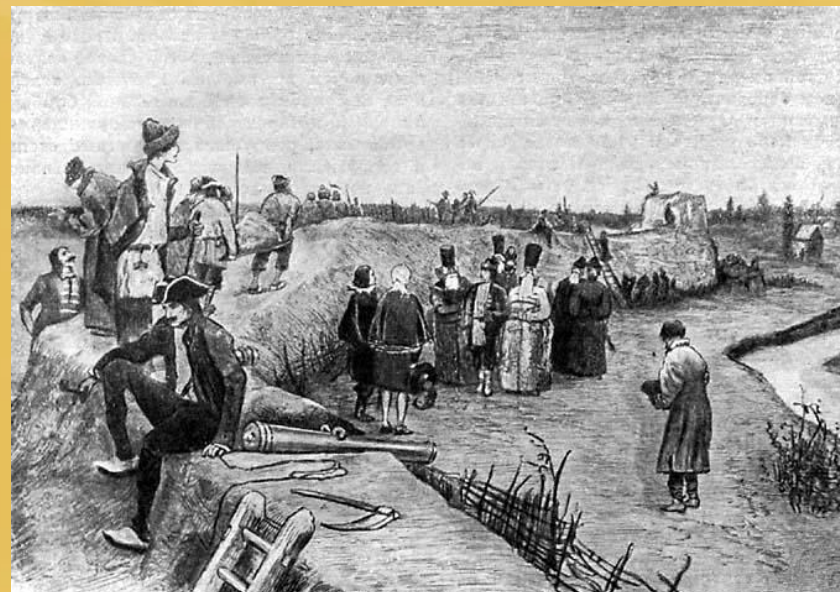
Постройка потешной крепости в с. Преображенском