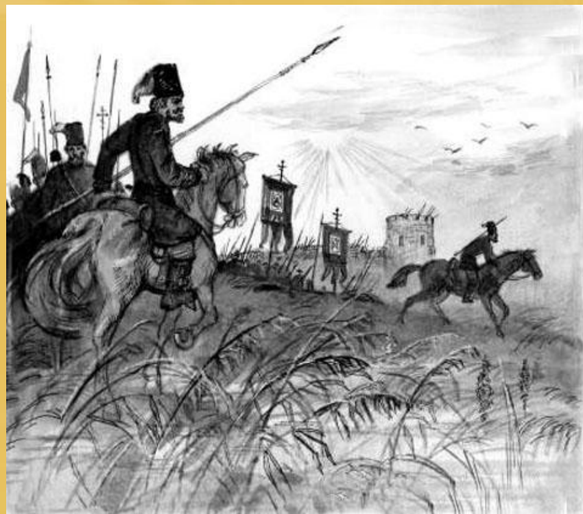
У Азовской крепости. Худ. Д. Поляков