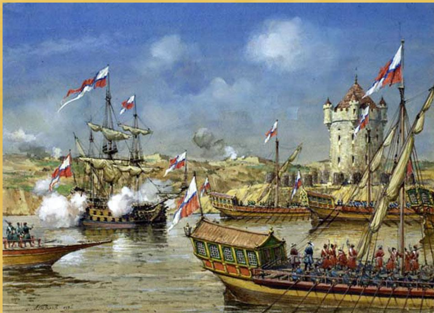
А. Тронь. Взятие Азовской крепости