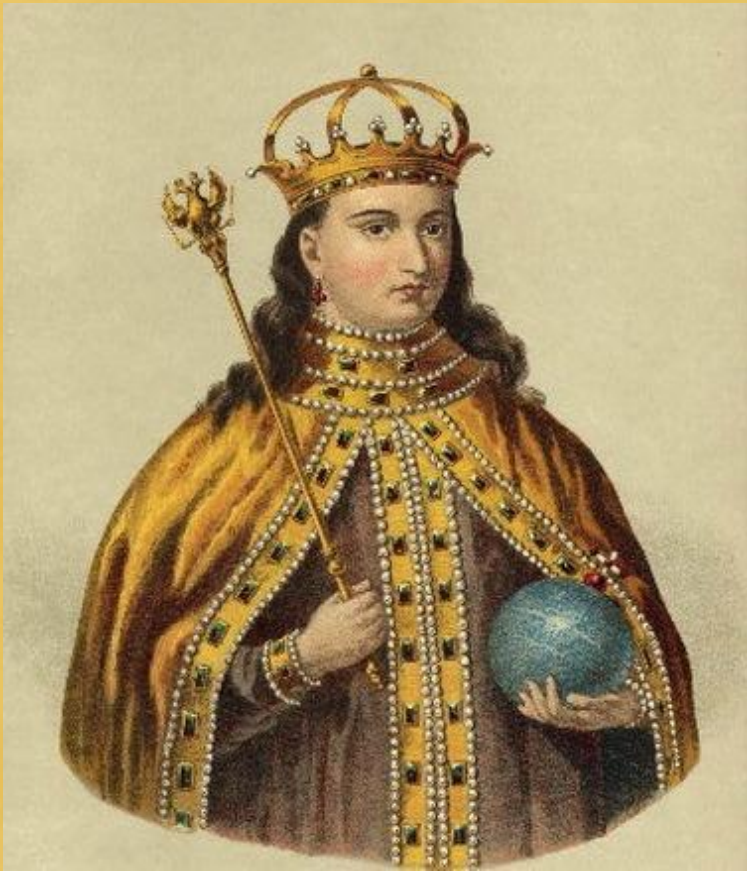
Царевна Софья Алексеевна