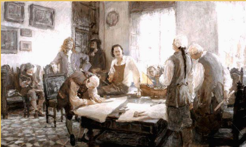
Ю. Кузнецкий. Экзамен Петра I