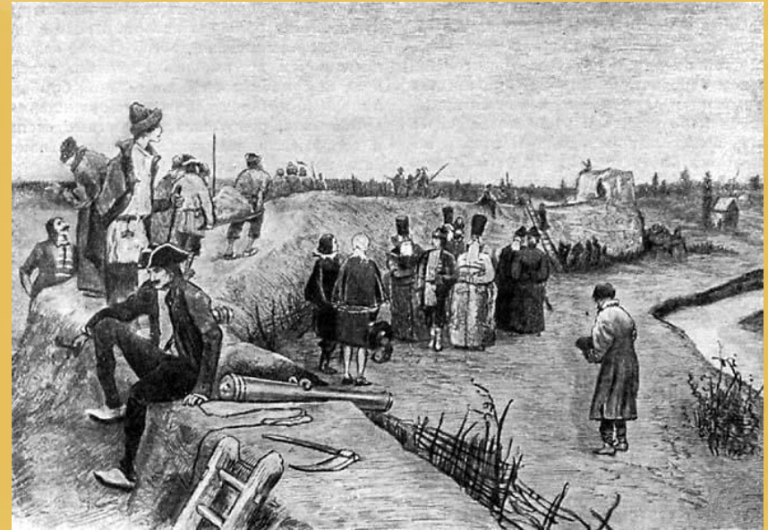
Постройка потешной крепости в с. Преображенском