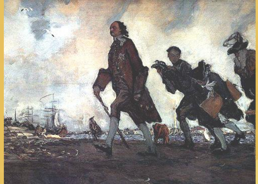
В. Серов. Петр I