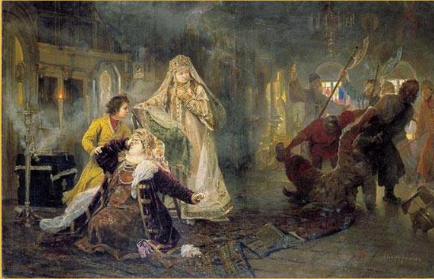
А.И. Корзухина. Сцена из истории Стрелецкого бунта в 1682