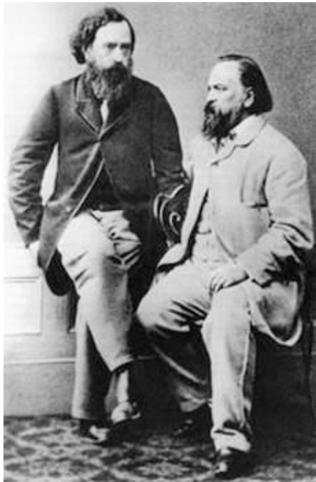
А.И. Герцен и Н.П.

Основой революционно-демократического движения с в 20-30-е годы XIX века становятся студенческие кружки: