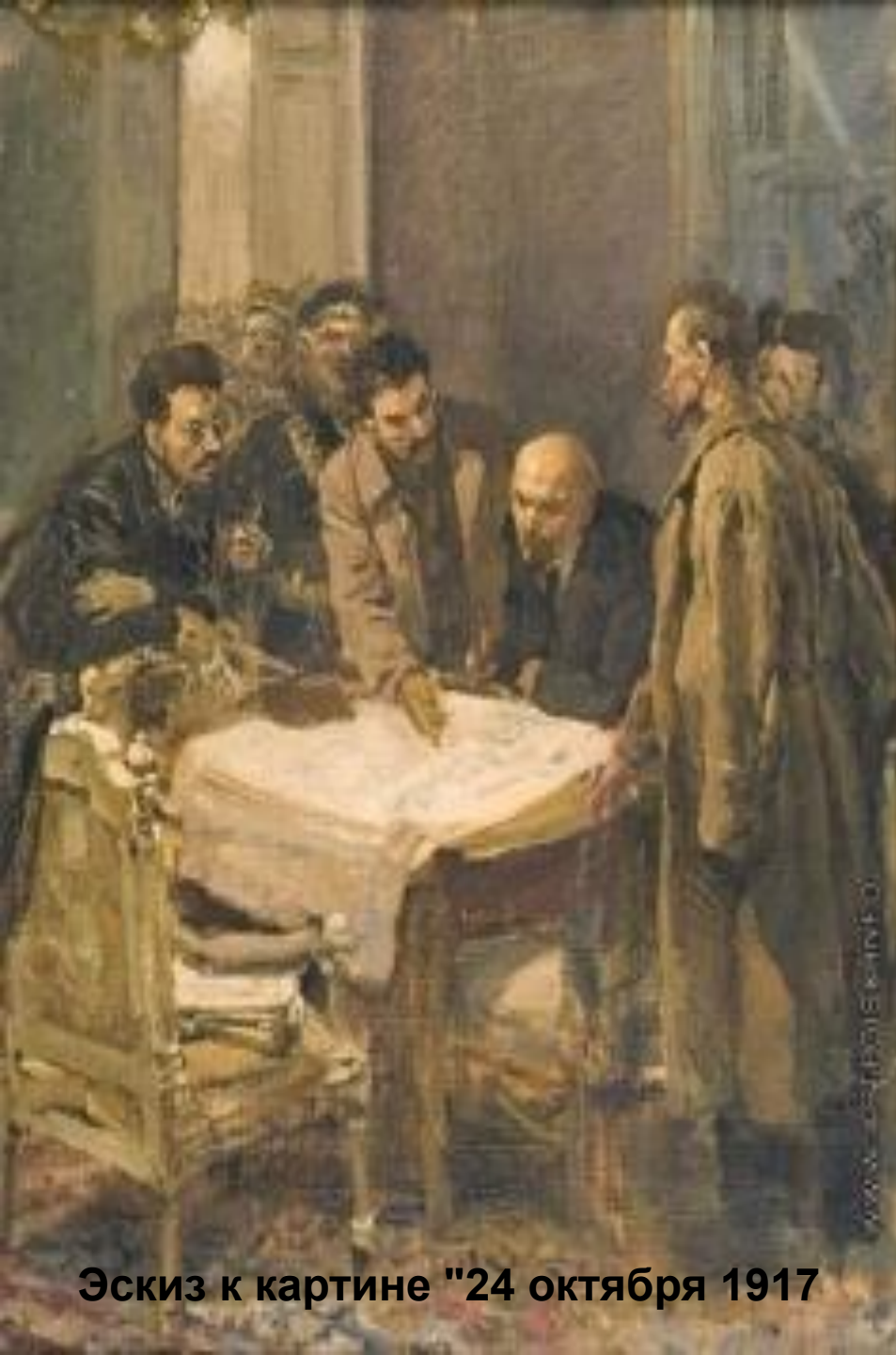
Эскиз к картине "24 октября 1917"