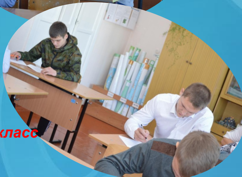
Храмов 11 класс