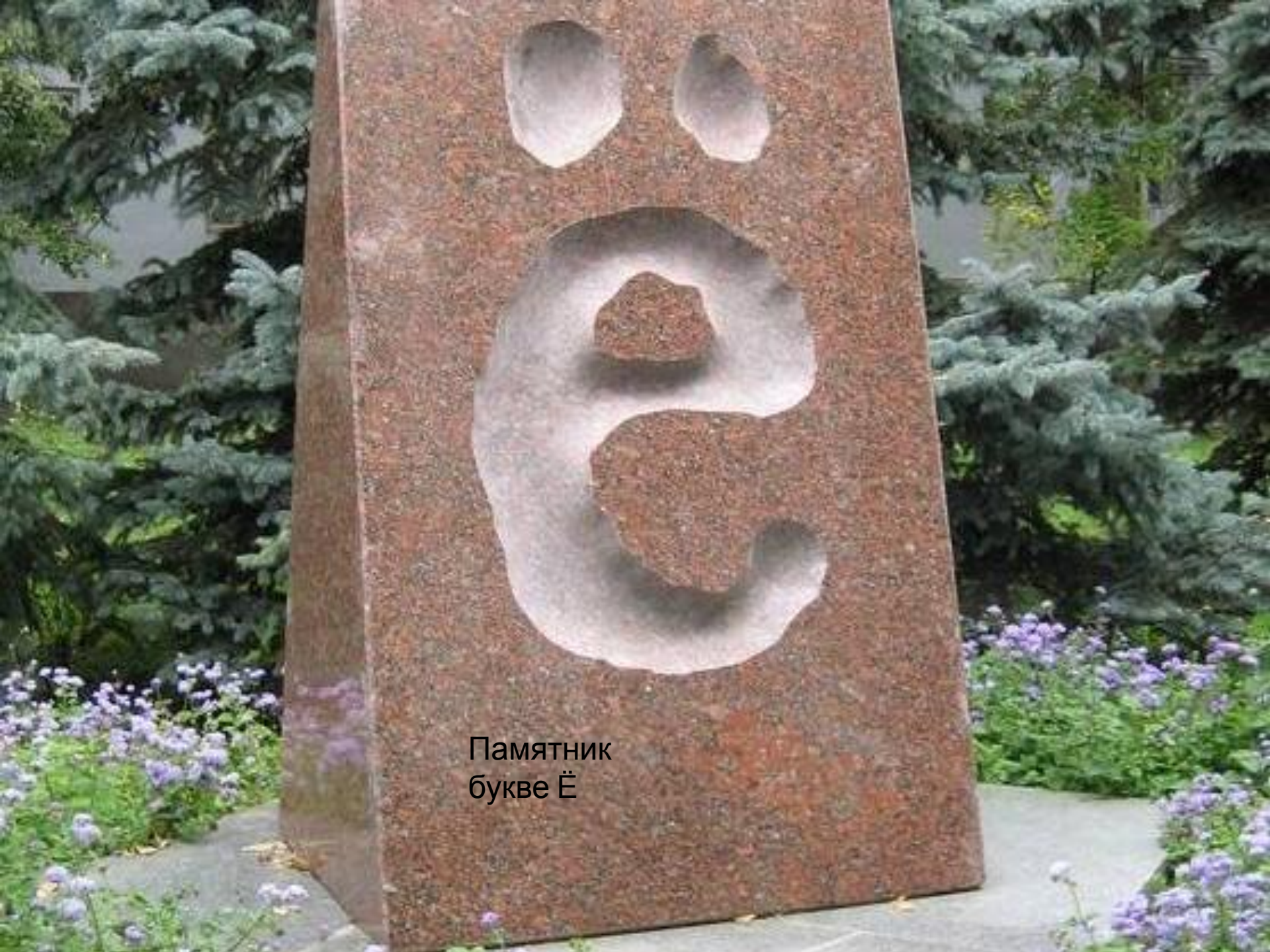
Памятник букве Ё