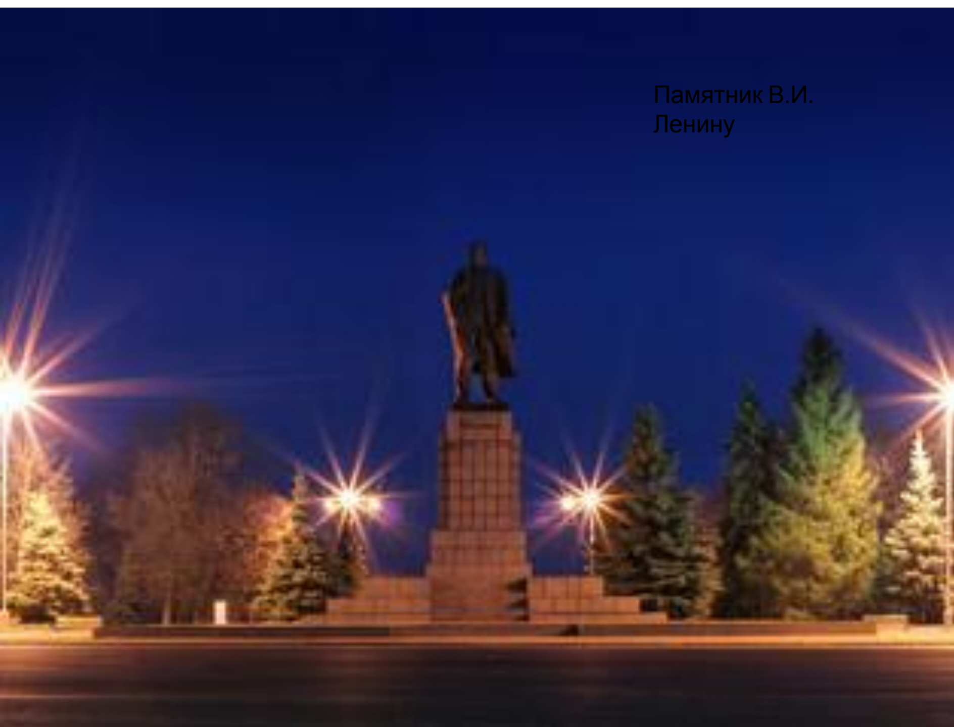
Памятник В.И. Ленину