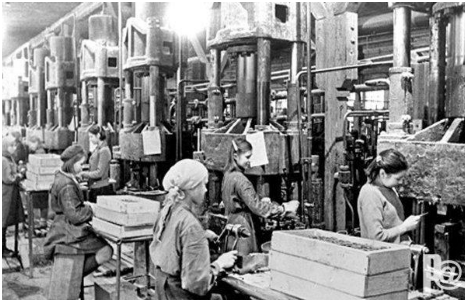
Дети города Ульяновска - фронту