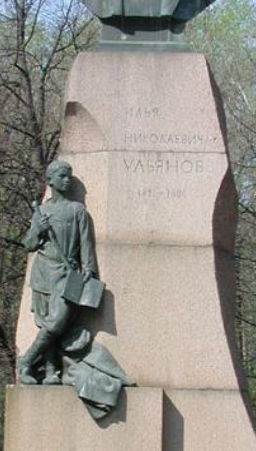
Памятник И. Н. Ульянову