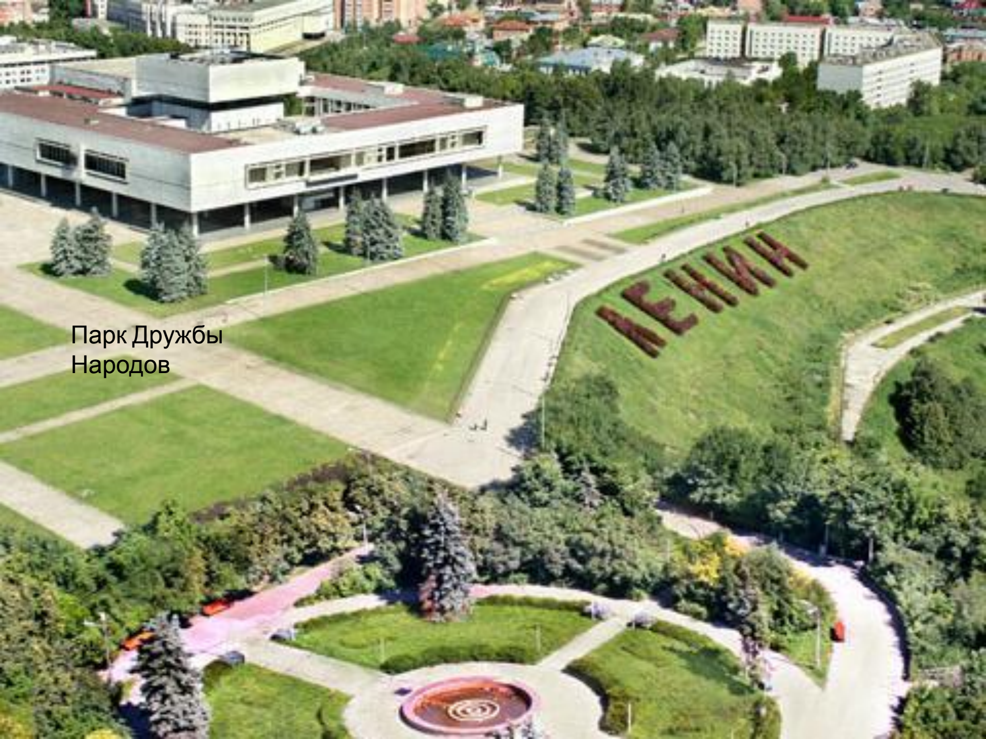
Парк Дружбы Народов