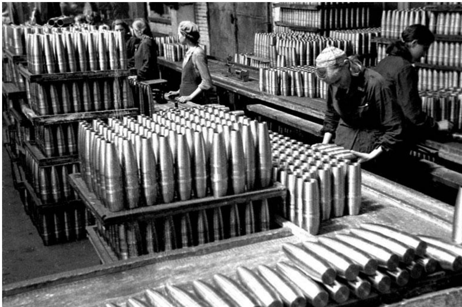
Завод имени Володарского-знаменитый патронный завод