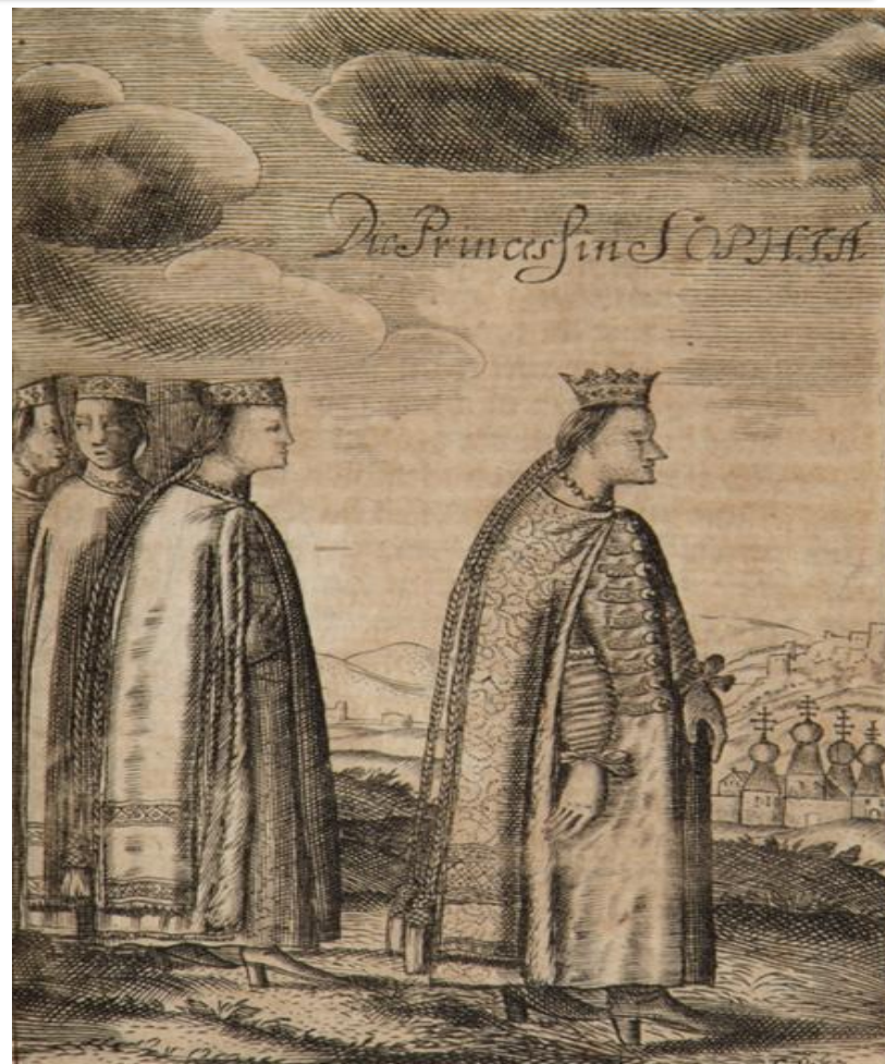
Софья Алексеевна, царевна. Гравюра. Конец XVII века