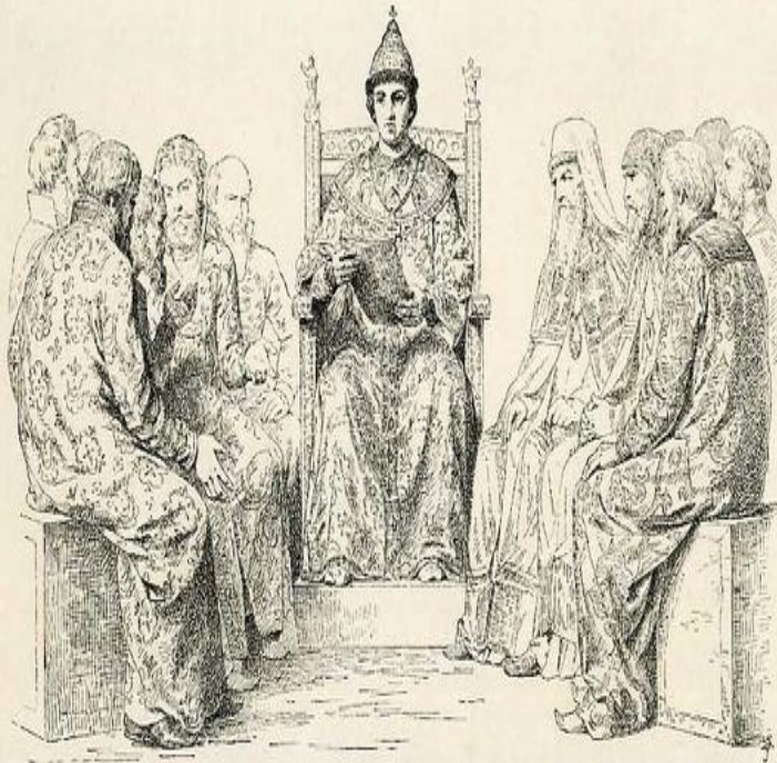
Самодержец Царь Федоръ Алексеевичъ.

Сын Алексея Михайловича Федор Алексеевич, воспитанный Симеоном Полоцким, укрепил за Россией Украину и Запорожье, основал первую Духовную Академию и уничтожил едигоннаветное, враждотворное, братоненаветное и любовь отгоняющее мезтиничество.