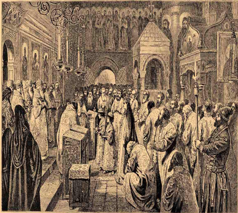
2. Вывачаніе на царство царей Іоанна и Петра Алексеевичей, 25-го іюня 1682 года.